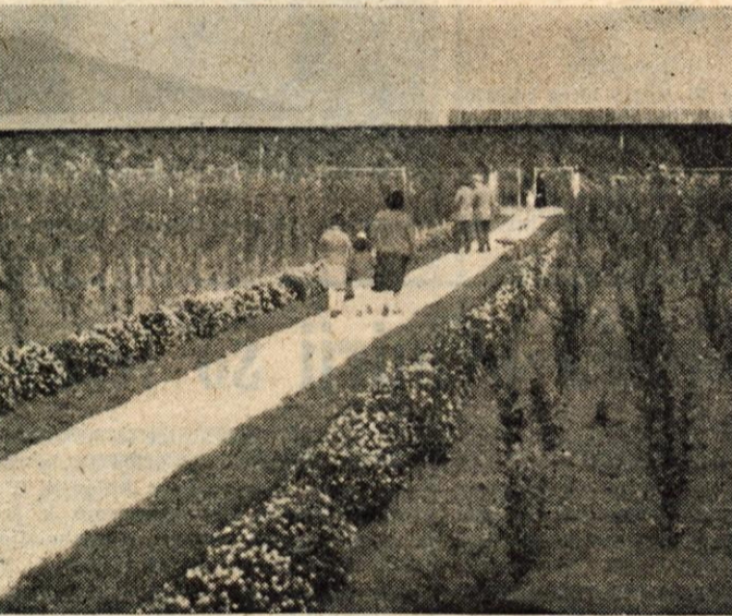
Drevesnica v Cerkljah

OBRAČUNI BIVŠIH OBČIN, ki so zdaj vključene v veliko kamniško občino, kažejo za leto 1955 14 milijonov prežekov, ki dajo skupno s 7 milijoni presežka od bivšega Ljudskega odbora mestne občine Kamnik 21 milijonov. Ta denar leži deponiran, novi ljudski občinski odbor pa ga ne more uporabiti, čeprav bi ga zelo potreboval. Ca-