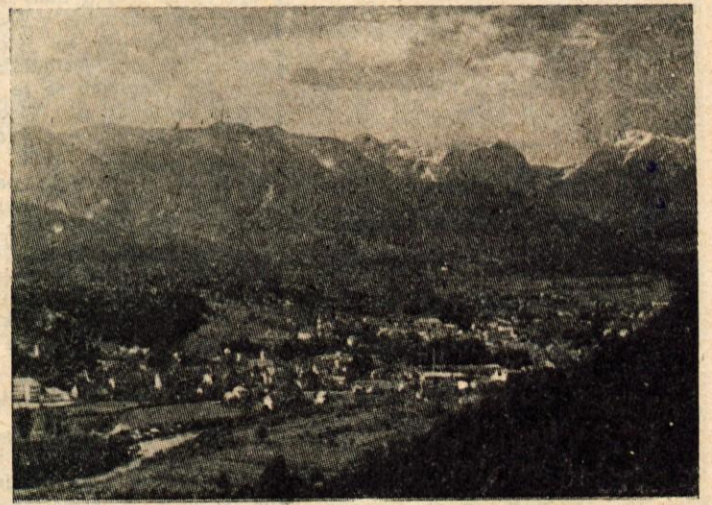
Pogled na Kamnik

AVTOPARK REŠEVALNE POSTAJE v Kamniku je slab in ne ustreza več potrebam industrijskega mesta. Številno nesreč v obratih je sorazmerno veliko, zato je tudi nujno potrebna hitra in zanesljiva zveza z Ljubljano. Reševalna postaja ima dva avtomobila je kaj slabo uspela. Tako malo razumevanja menda v Kamniku še niso pokazali za nobeno zbirko. Niti 50.000 din ni bilo nakazanih v ta namen. Položaj je rešil ObLO Kamnik, ki je dal garancijo za najem posojila za novi rešilni avtomobil. Z.