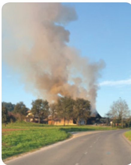
Stari vasi zagorel hlev s številno živino. Ogenj je po tiho širil svoje vroče lovke, živina je klicala na pomoč, vse dokler

Svojo veliko srčnost so izkazali tudi v ponedeljek, 17. 9. 2018, ko je v Veliki