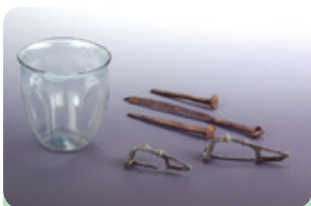
Rimskodobne najdbe iz grobov v Podgorici pri Šmarju, datacija 1. do 2. st. n. š..

zapisano ime cesarja, ki je ukazal dela, in razdalja do naslednjega mesta ali poštna postaja v rimskih miljah ( milliapassuum = 1,47 km). Poleg odkritih vozišč ali miljnikov imamo še nekaj posrednih pričevanj o potekih rimske cestne mreže, kot so grobišča (vedno izven naselij, navadno ob cestah) in stara krajevna imena, npr. Tlake (tlak) in Razdrto (ruševine).