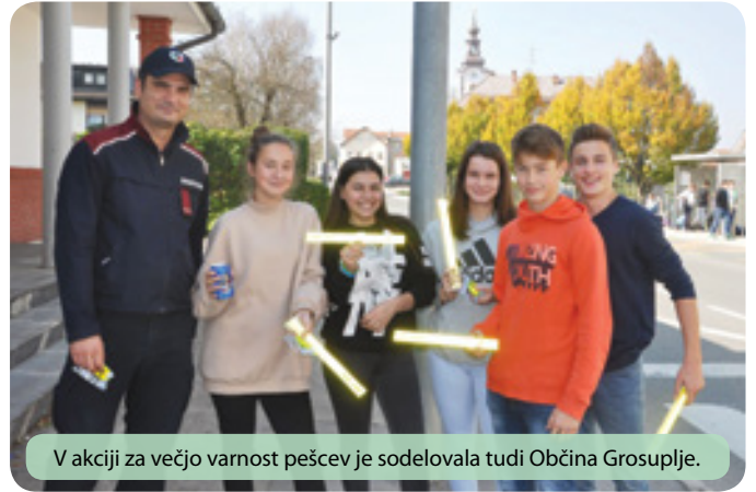
V akciji za večjo varnost pešcev je sodelovala tudi Občina Grosuplje.

Občina Grosuplje se je uspešno prijavila na javni poziv Javne agencije RS za varnost prometa in v uporabo med drugim dobila več triopanov »usposabljanje kolesarjev«, odsevnih brezrokavnikov za kolesarje in kolesarskih čelad, ki smo jih razdelili učenkam in učencem ter njihovim učiteljicam in učiteljem v naših osnovnih šolah.