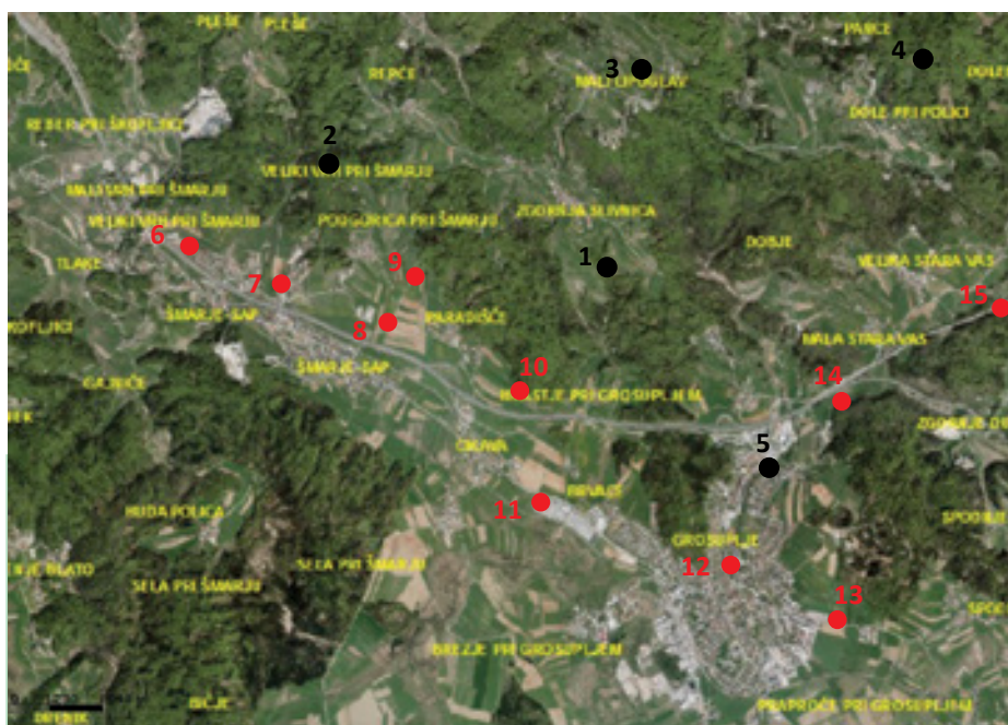
1 – Magdalenska gora, 2 – Veliki Vrh pri Šmarju, 3 – Mali Lipoglav, 4 – Pance, 5 – Brinjski hrib pri Grosupljem, 6 – Tlake, 7 – Razdrto (danes Rimska c.), 8 – Šmarje-Sap, 9 – Farovski hrib, 10 – Paradišče, 11 – Sela pri Šmarju, 12 – Grosuplje, ob železnici, 13 – Grosuplje, ob cerkvi sv. Mihaela, 14 – Perovo, 15 – Velika Stara vas (črno: prazgodovinska najdišča, rdeče: prazgodovinska in rimskodobna ali samo rimskodobna najdišča ter sledi rimske ceste; vir: Register kulturne dediščine Slovenije).

Po propadu rimske državne uprave – v našem prostoru je bil denarni obtok prekinjen v prvi polovici 5. st. – cestne mreže ni nihče več vzdrževal. Kljub