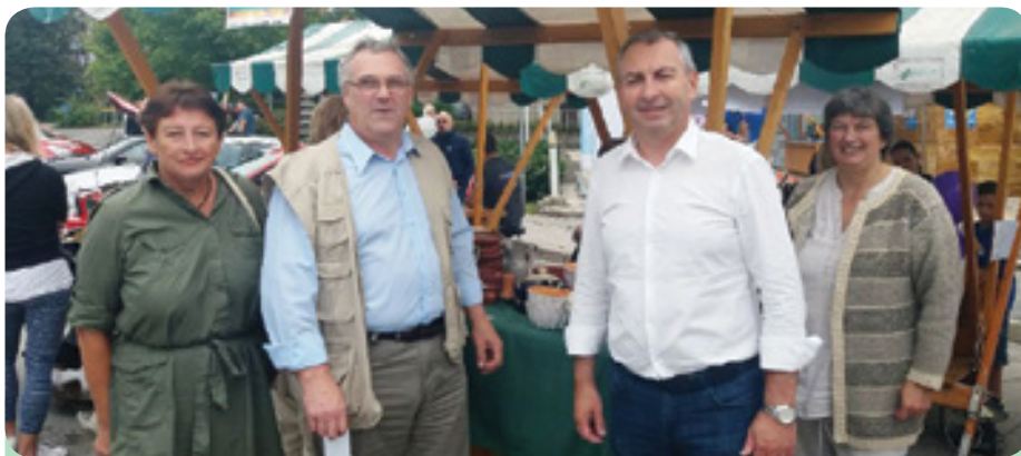
Del vodstva OO NSi Grosuplje na prireditvi Grosuplje v jeseni

Grosuplje – Krščanski demokrati v občini Grosuplje po državnozborskih volitvah s polno energije, samozavesti in poguma vstopamo v zadnje obdobje leta 2018, ko naš čakajo tudi lokalne volitve. Rezultat državnozborskih volitev nam je vлил prepričanje, da trdo delo na vsebinskem in kadrovskem področju prinese rezultate. Zelo smo veseli, da so se nam v zadnjem obdobju priključili novi kadri, ki so nam prinesli še dodatno vsebinsko obogatitev oziroma rešitve za boljše življenje vseh nas v naši občini Grosuplje. Tako smo na vseh naših zadnjih sestankih občinskega odbora pripravljali rešitve za novo 4-letno obdobje mandatnega obdobja 2018-2022, ki ga bodo opravljali člani Občinskega sveta Občine Grosuplje in župan. Svojo podporo izražamo številnim dejavnostim, zato smo se kot delegacija tudi udeležili in s svojo pristnostjo podprli številna društva, klube in podjetja na tradicionalni prireditvi »Grosuplje v jeseni«. Prav tako pa smo opravili številna uradna srečanja z različnimi deležniki v naši občini. Vse z namenom, da še bolje spoznamo dejavnosti posameznih organizacij in prisluhnemo njihovem razmišljanju ter