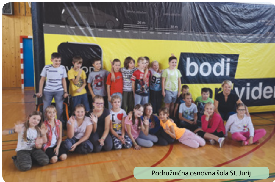
Podružnična osnovna šola Št. Jurij

zitivni odnos do uporabe kolesarskih in drugih varnostnih čelad ter spodbujati njihovo uporabo.