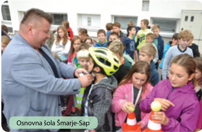
Osnovna šola Šmarje-Sap