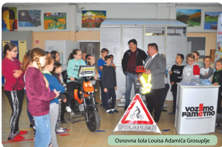
Osnovna šola Louisa Adamiča Grosuplje

Že nekaj dni pred tem pa je na Podružnični osnovni šoli Št. Jurij potekala tudi preventivna akcija Bistro glavo varuje čelada. Namen te akcije je oblikovati po-