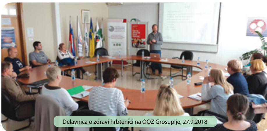
Delavnica o zdravi hrbtenici na OOOZ Grosuplje, 27.9.2018