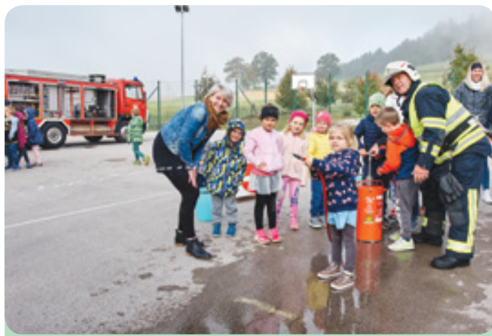
Vrtčevski otroci so se preizkusili v »špricanju iz brentače«

Vsako leto meseca oktobra z različnimi aktivnostmi obeležimo mesec požarne varnosti, letos pa smo združili teden otroka, požarno varnost in praznovanje 10. obletnice vrtca Zvonček.