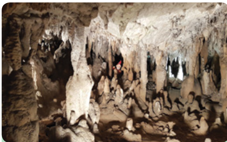
Palčki – čuvaji kapnikov

V ponedeljek, 1. oktobra 2018, smo z otroki in njihovimi starši obiskali Županovo jamo ter tako skupaj otvorili naše celotedensko praznovanje 10. obletnice vrtca Zvonček in obeležili svetovni dan otroka. Pred Županovo jamo smo se zbrali v zelo velikem številu in napolnili tri ogledne skupine, ki so odšle v jamo v