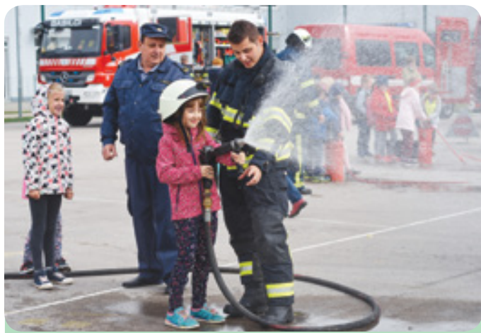
Bodoče gasilke pri gašenju z visokim tlakom