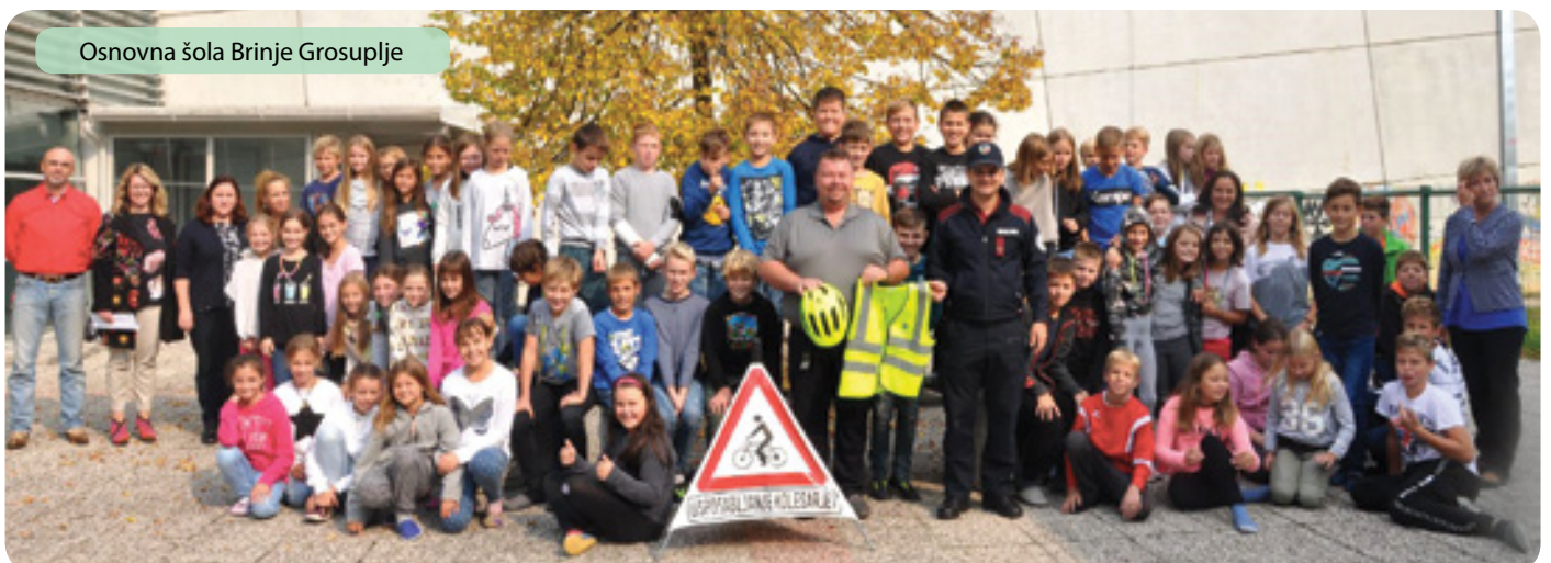
Osnovna šola Brinje Grosuplje