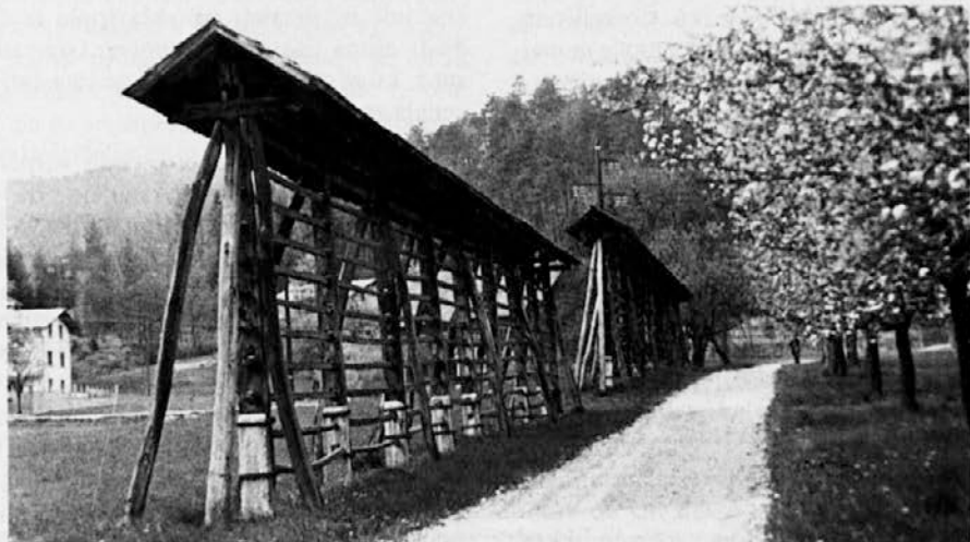
Pomlad v deželi pod Triglavom