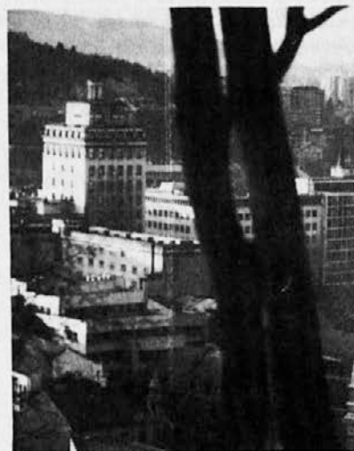
Pogled z Gradu na središče Ljubljane