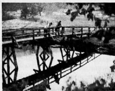
Mostič preko Krke