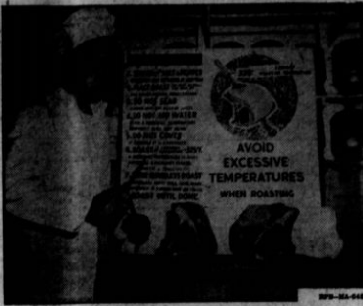
A soldier training under the Army's Food Service Program learns to prepare meat cuts for roasting. The chart on "How to Roast" in the background is the result of extensive testing and research by the Quartermaster Corps.