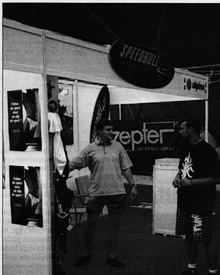
Stanko Kranjc (levo) je koordiniral delo na Fitfestu