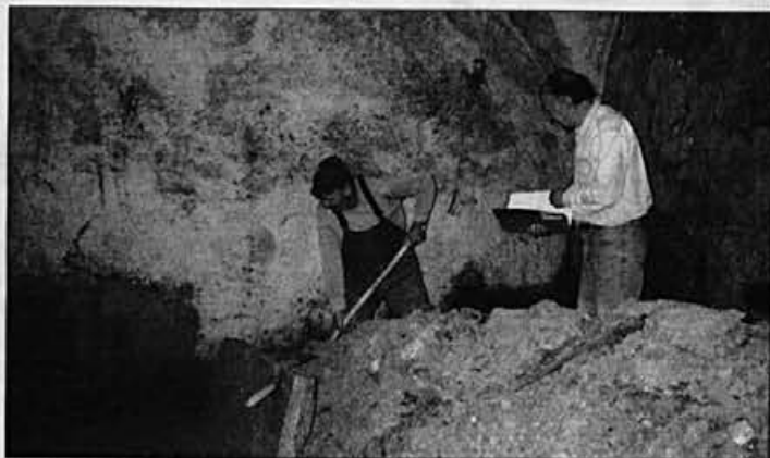
V Stari šoli so očistili temelje, da bi jih kasneje lahko zaščitili pred vlago