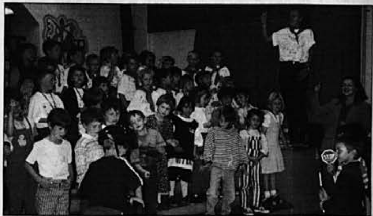
Živahen nastop malčkov ob pomoči svojih vzgojiteljic