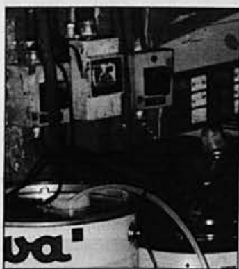
Elektro inštalacije in nevarne snovi (lepila) ne smeta biti v neposredni bližini. Poškodovana stikala, odprte posode z lahko gorljivo snovjo in zamašena neočiščena komora neposredno ogrožajo delavčevo zdravje in so velika potencialna nevarnost za nastanek požara in eksplozije