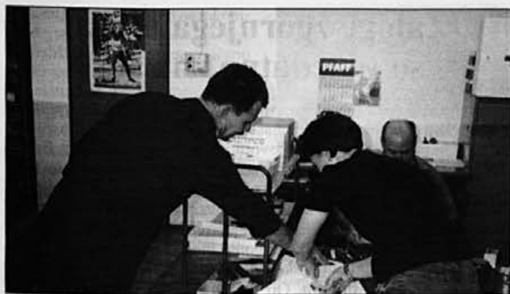
Dogovor o nadaljnjem delu