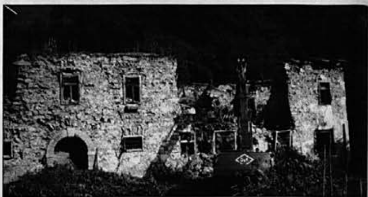
Štalarjeva hiša pred rušenjem