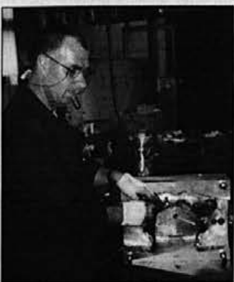
Prah aluminija, ki nastane pri izdelavi orodij v orodjarni, je strupen. V telo delavca se vnese z dihanjem in preko kože. Potrebno bo urediti lokalo odsesavanje