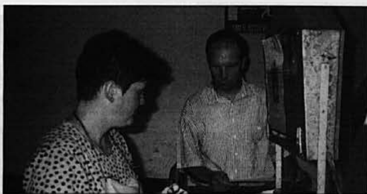
Iznajdljivost delavcev ne pozna meja. Kjer ni posod za lepilo, se lahko uporabi tudi kuhinjska skleda s pokrovom. Vendar le-ta ne tesni dovolj

Na delovnem mestu urejajo varnost in zdravje pri delu interni