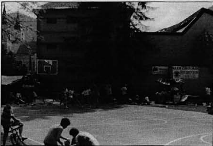
Bogat program študentskega vikenda '98

Nenazadnje se moramo zahvaliti našim sponzorjem, ki so v obliki praktičnih nagrad, prispevali nagrade za najboljše tekmovalce ali pa nagrade, ki smo jih podelili kar tako. Sponzorji VIKENDA ŠPORTA so bili: MDESIGN, GOSTILNA PRI ŽUPANU, AVTO FRELIH, GOSTILNA IN PRENOČIŠČA MARTA MAČEK, KINO ŽIRI, HRAM NA VOLERJI, CAFFE GEPARD, GOSTILNA SORA, TRGOVINA PRI MARIŠI, AVTOODPAD BINE, BBC AMBASADA, PIZZERIJA GAČNK, RADIO SORA.