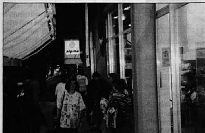
Gneča pred prodajalno na dan otvoritve