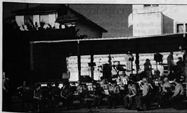
Pihalna godba Alpine je ob pomoči ansambla AS pripravila lep večer