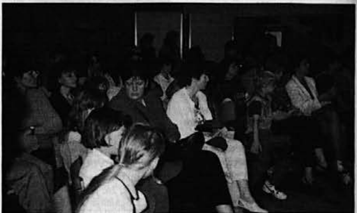
Starši in drugi otroci so z zanimanjem spremljali program male šole