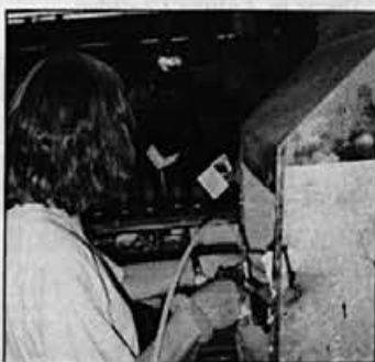
Pri delu uporabljamo osebna zaščitna sredstva. Zaščita rok, telesa in dihal je obvezna pri uporabi nevarnih snovi. Odsesovalna komora ni dovolj. Zappestnice in ure sodijo pri takem delu v garderobo