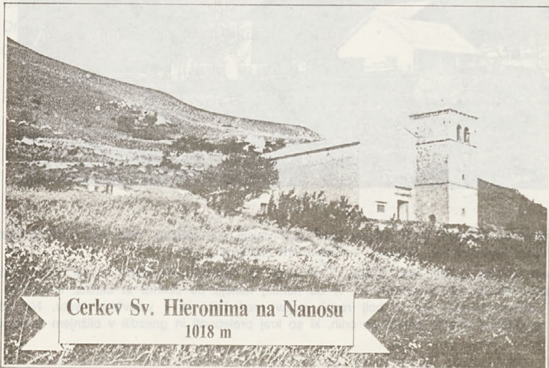
Cerkev Sv. Hieronima na Nanosu

Na Pleši (1261m) je že od daleč viden stolp RTV oddajnika, ki kljubuje najmočnejši primorski burji. Po razglasitvi samostojne Slovenije je "Jugoslovanska ljudska armada" hotela nasilno uničiti ta pomembni objekt. Tako je z letali napadala oddajnik, razrušila stolp in poškodovala ostale naprave ob njem. Planinska koča pod oddajnikom nosi ime po narodnem junaku Janku Premrlu-Vojku. Na drugi strani kočje je postavljen Vojkov čoprsni kip iz bron, ki so mu ga postavili borci in planinci Primorske in Notranjske.