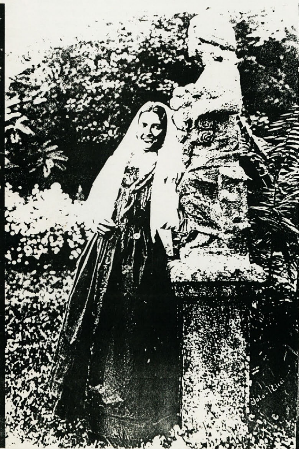
VIPAVSKA NARODNA NOŠA (1939)