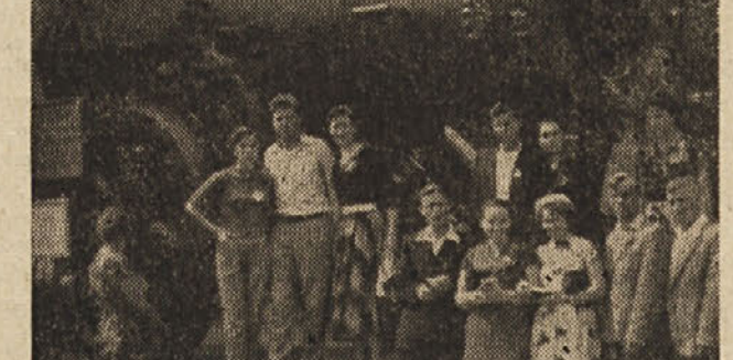
Nekateri člani tržaške delegacije v družbi sovjetskih prijateljev in carskega topa

Ob desetih nas pregleda zdravnica in ko odide, zavlada v bolnici prava anarhija. Sprehajamo se po hodniku in dražimo sestre, ki od jeze skoraj znorijo. Mi namreč izkoriščamo dejstvo, da jih ne razumemo in tako delamo, kar se nam zljubi. Toda, ko zapojejo Katjušo v vseh jezikih, se sestre umirijo in nas celo hvalijo. Med nami je tudi črnce iz mlade afriške države Gane. Sedaj študira v Londonu in ko pride domov, bo koristen voditelj svojemu ljudstvu. Nek Švicar zbira spoznanja iz Moskve, pač pa je hud nahod napravil iz njega pravo odlično cev iz katere vedno kaplja. Edini zamašek pa mi je v tem primeru robec, katerih pičlo število tri sem prinesel s seboj. Iz tega sledi, da se ti kaj kmalu zmojijo; zato jih zvečer malo operem in ponoči sušim. Včasih me prime da zapojem: 'Nobena ni taka kot... ki v orenci pere in v kaminu suši...' Tedaj se zgodi, da me moj nemški sosed (tisti, ki je de-