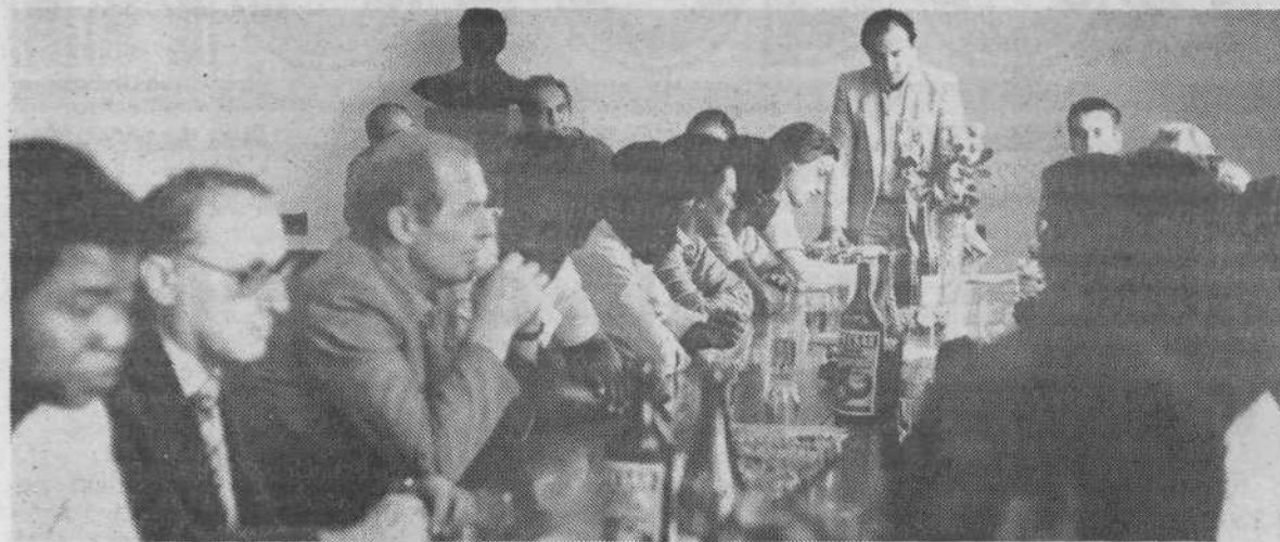
23. 9. je občinska konferenca SZDL priredila v skupščini občine Center sprejem za 17 namibijskih študentov, predstavnikov gibanja SWAPO. V mednarodnem centru za upravljanje podjetij v družbeni lasti v Ljubljani so študirali od marca do septembra 1982. To je bila že tretja skupina študentov, ki jih je poslal Svet za Namibijo pri OZN k nam na študij.