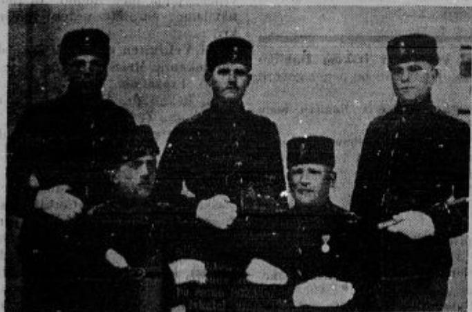
5 naših fantov od kraljeve garde v Belgradu.

"Belo ko češnjecvet je -perilo!" - kakor hitro je oprano z Gazelo!