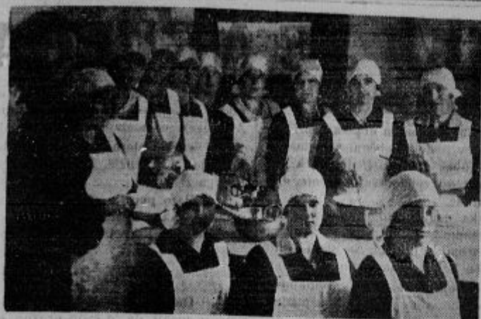
Dekleta gospodinskega tečaja na Homcu.