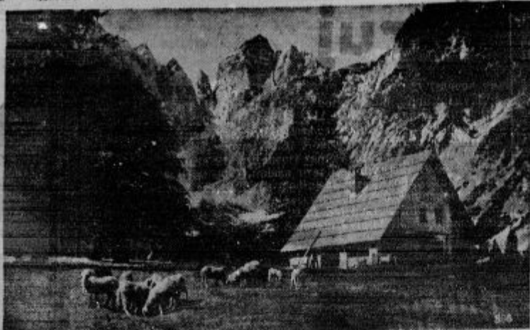
Planica—Tamar—Jalovec (2643 m)