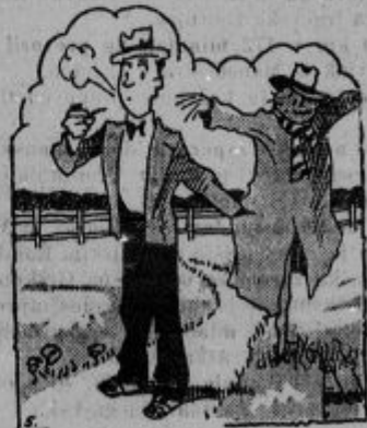
Mož navade: Zepar na poštnicah.

Zrušil se je železniški predor v Andah; 40 delavcev mrtvih.