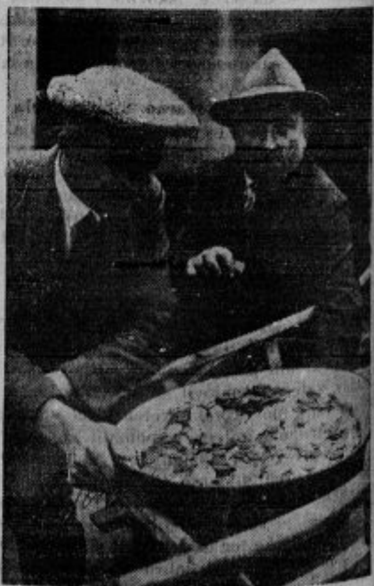
(Glej dopis od Dev. M. v Polju.)