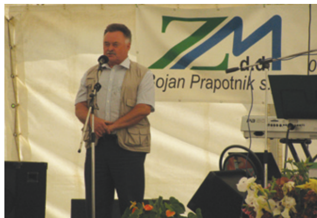
Predsednik MZDU Ormož