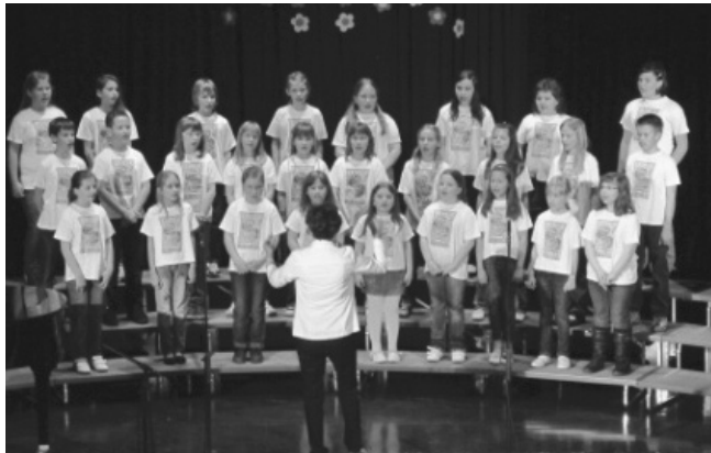
Otroški pevski zbor OŠ Središče ob Dravi