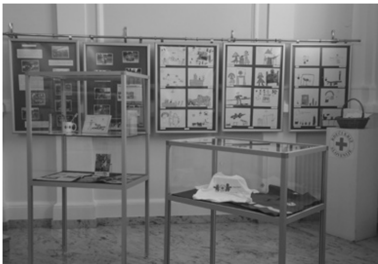
Razstava v avli Občine Ormož

Pod tem geslom je v letošnjem letu potekal teden Rdečega križa, ki smo se ga spomnili med 8. in 15. majem. 8. maj je mednarodni dan Rdečega križa, na ta dan se je leta 1828 rodil ustanovitelj Rdečega križa Švicar Henry Dunant. Na Rdečem križu Slovenije - Območnem združenju (RKS OZ) Ormož smo v počastitev tedna RK v avli občine Ormož postavili razstavo, na kateri smo prikazali aktivnosti, ki jih v sodelovanju z Medobčinsko LAS izvajamo za mlade. Posebno