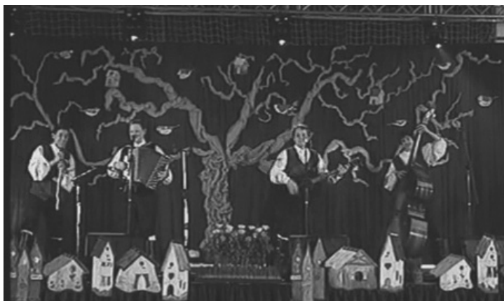
Predskupina Modrijani na odru

pridno pilili svoje nastope. Koncert smo pričakovali na trnih, a vendar zelo navdušeni. Ko je občinstvo začelo prihajati, smo vedeli, da sedaj res gre popolnoma zares. Izvedli smo svoje točke. Publika jih je, so-deč po odzivu, navdušeno sprejela. Iskreno se zahvaljujemo vsem. ◀