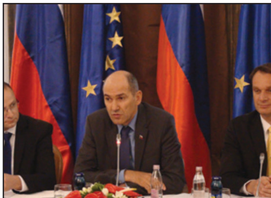
Stran 4: Obisk Vlade RS v Ormožu