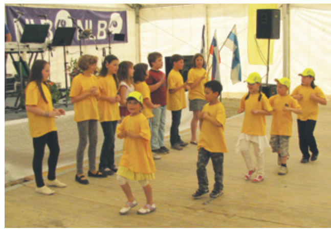
Nastopajoči na srečanju