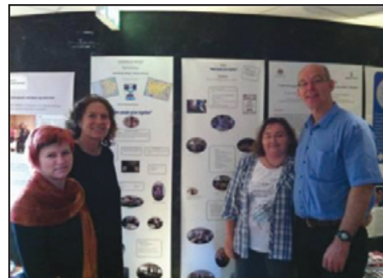
Stran 7: Comenius Regio