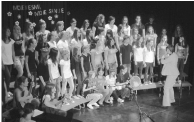
Mladinski pevski zbor OŠ Ormož