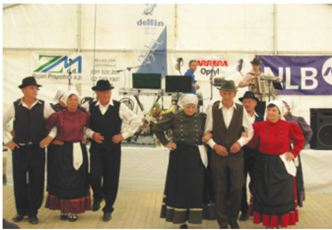
Nastopajoči na srečanju

udeležencev organizirali avtobusne prevoze, tako so se mnogi izognili lastnemu prevozu. Bilo je veselo. Ob odhodu smo si zaželeli zdravja in ponovnega veselega srečanja v letu 2013, v Ormožu. ◀