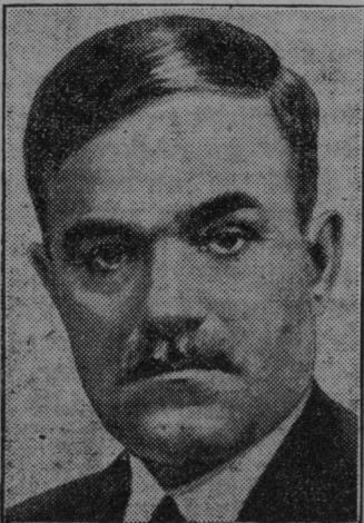
Polkovnik D. Velčev, organizator v ka-li zatrtega najnovejšega puča na Bolgarskem.

Vlom v dobrodelni zavod. V Strelški ulici v Ljubljani je zavod sv. Marte, ki nudi zavetje siromašnim služkinjam. V ta zavod sta prišla po opravih dva neznanca in sta odnesla iz stanovanja upraviteljice, v katerem je blagajna, 3000 Din.