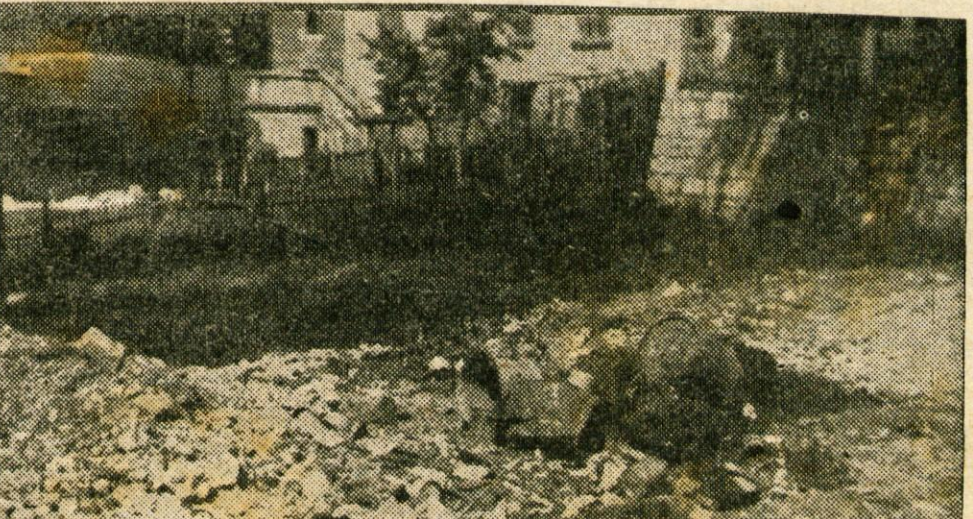
Koliko podobnih »pokopališč odpadkov, starega železa, posode, papirja, stekla in cunj je še po Dolenjskem? V Tednu zbiranja odpadkov jih marsikje še niso odkrivali. Poskrbimo, da se odstranijo taki dokazi malomarnosti naših odnosov do razvijajoče se industrije, ki potrebuje vedno več surovin in odpadnega, še uporabnega materiala.

Teden zbiranja odpadkov je za nami, pred nami pa je dolžnost do skupnosti, da vpeljemo zbiranje odpadkov kot stalno delo.