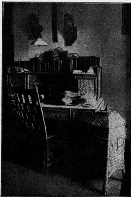
Krekova pisalna miza.

Manjka nam pa še vedno celotnega popisa vseh naših krajev in znamenitosti. Skoro je človeka sram povedati, da je tujcem lepota naših krajev bolj znana kakor domačinom. More-