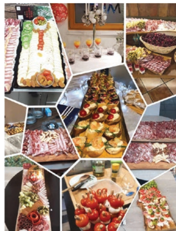
Za društva, podjetja in posameznike pripravlja Melita raznovrstne narezke po naročilu.

Prav posebna preizkušnja je bil čas epidemije covid, ko so bili gostinski lokali zaradi državnih ukrepov od 15. marca do 4. maja 2020 popolnoma zaprti. Saj se še spominjate teh časov, kajne? »Ko sem lahko lokal spet odprla, sem s prodajo dobila le toliko, da sem lahko preživela,« se z grenkobo spominja negotovih časov gostinskega sektorja, ki so trajali od sredine marca 2020 do sredine februarja 2022. Po oddaji vloge je od države dobila nekaj denarja, s katerim je poravnala več zapadlih mesečnih najemnin. V tistem koronskem obdobju so jo pristojni organi večkrat obiskali. »Toliko inšpektorjev in policistov, kot me je takrat nadzorovalo, dotlej še videla nisem. Prišli so, ker so prejeli več prijav domnevnih kršitev.« Na nikogar ni jezna, nikogar ne obtožuje, žalostita jo le brezmejna človeška neumnost