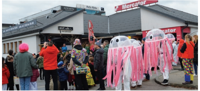
Ena od okrepčilnih postaj pustnega sprevoda je tudi Muc caffe, kjer pustne maske razvajajo s sladkim presenečenjem in toplim čajem.

Zavzeta gostinka vsak mesec, večinoma ob petkih, pripravi svojim gostom posebno ponudbo, ki je vezana na praznike, kot so pustovanje, dan žena in mučenikov, gregorjevo, martinovanje, veseli december ... Ob tem praznovanja občasno popestri tudi z glasbenimi gosti. Še bolj pestro je poleti, ko velikokrat tudi med tednom ponuja osvežilne napitke po posebnih cenah. Poleg tega ob sobotah oddaja lokal za razna praznovanja, pri čemer poskrbi tudi za hrano in okrasitev, primerno praznovanju. Organizirala je že več Mucevih pohodov po okoliških hribih, sodeluje pa tudi pri organizaciji trzinske tržnice in garažne razprodaje. Pravzaprav se odzove vsakemu povabilu domačih društev. Tako je pri njej že več let postanek udeležencev pustnega sprevoda. Lani pa je poskrbela tudi za kulinarčno ponudbo na trzinskem sejmu in ob trzinskem prazniku (700