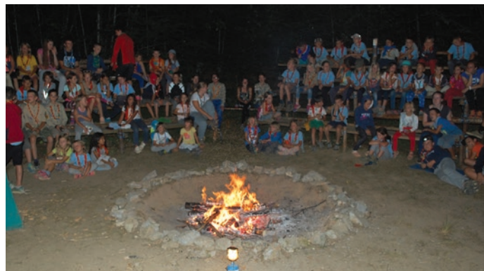
Nepozabni poletni tabori so polni zabavnih dogodivščin.