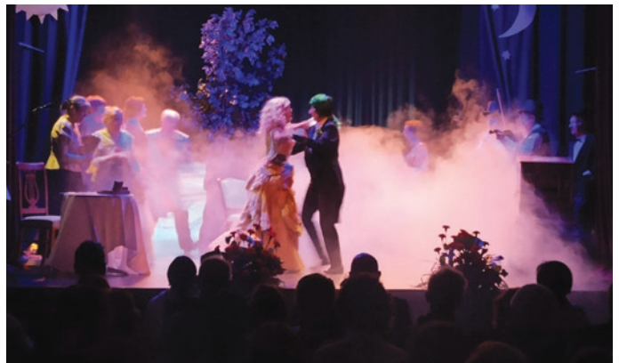
Poskrbeli so tudi za teatralnost na odru!