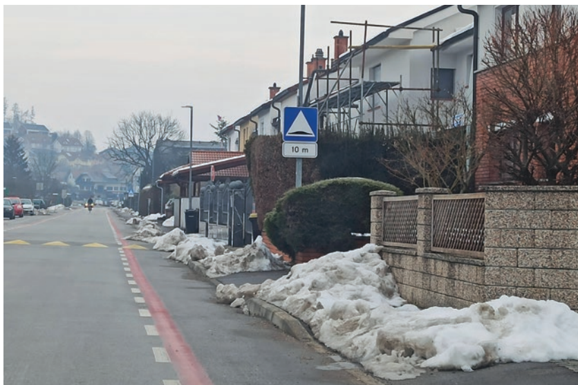
Pločniki v Kidričevi ulici so bili več kot pol meseca neprehodni.

Januarja po obilni snežni pošiljki se je več občanov obrnilo na nas po pojasnila, zakaj pločniki po različnih delih Trzina niso bili urejeni, delno so bile s snegom zasute tudi kolesarske steze. Pešci ponekod niso imeli druge izbire kakor hoditi po cestišču, kolesarji pa so morali na kolesarskih stezah sneg obvoziti in se ponekod voziti po cestišču. Ker se je sneg obdržal dalj časa in pločniki tudi po več dneh niso bili očiščeni ter po mnenju ene od občank za varnost pešcev ni bilo poskrbljeno, smo se obrnili na občino za pojasnila in jih povprašali, zakaj pločniki v nekaterih predelih Trzina po sneženju niso bili očiščeni več dni. Občina je poslala opravičilo. »V imenu Občine Trzin se opravičujemo občanom za morebitne težave, ki so nastale zaradi neurejenih pločnikov in kolesarskih stez po sneženju. Podobna opažanja, kot vam jih je poslala občanka, smo med sneženjem in pozneje ob pluženju občinska uprava in župan poslali vzdrževalcu. Med zadnjim sneženjem je v zelo kratkem obdobju padla zelo velika količina snega za