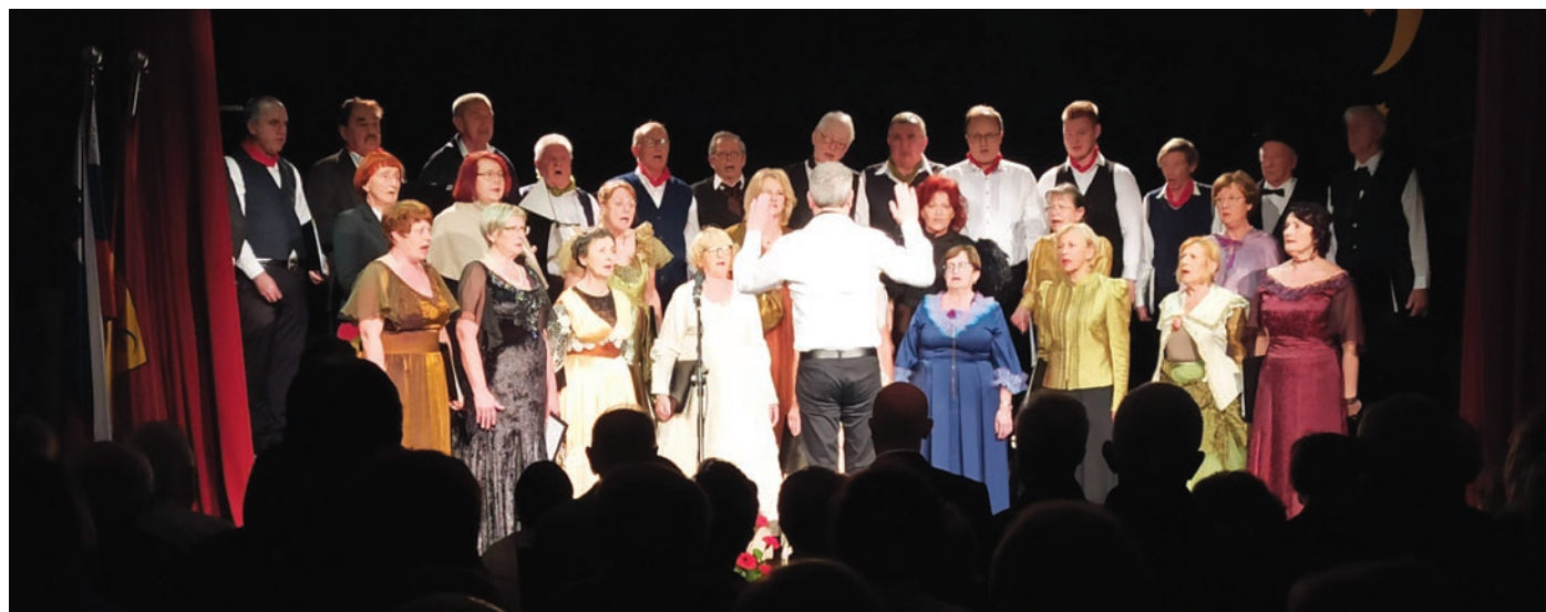
Zdravljico so zapeli člani in članice Mešanega pevskega zbora Ivan Hribar.

Letošnji Prešernov dan, slovenski kulturni praznik, ki ga zaznamujemo 8. februarja, smo na povabilo Občine Trzin in Kulturnega društva Ivan Hribar preživel v Kulturnem domu Trzin, kjer se je ob 18. uri začela občinska proslava. Eno uro trajajoča prireditev je potekala v organizaciji članov in članic Kulturnega društva Ivan Hribar, ki so do zadnjega kotička napolnili dvorano kulturnega doma in na odru poskrbeli za posebno presenečenje.