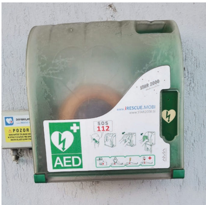
Avtomatski eksterni (zunanji) defibrilator (AED)

V Domu zaščite in reševanja v Trzinu je Društvo upokoencev Žerjavčki Trzin 29. januarja 2024 s pomočjo Rdečega križa organiziralo predavanje o temeljih oživljanja.