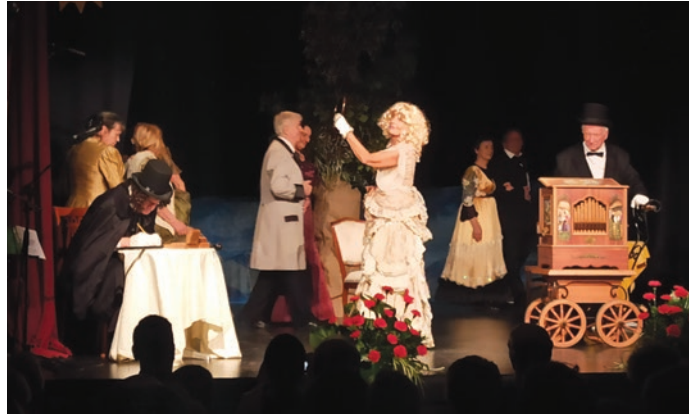
Povodnega moža so na odru uprizorili člani in članice Kulturnega društva Ivan Hribar.

Šele nato je sledilo veliko presenečenje večera. Za zaključek prireditve so se člani in članice Kulturnega društva Ivan Hribar iz pevec in recitatorjev prelevili v igralce in na odru uprizorili Povodnega moža . Sam Prešeren pa se je podal med obiskovalce prireditve in jim ponujal fige.