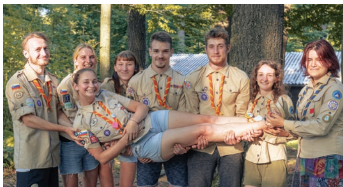
Taborniki, ki so vključeni v projekt Alpski prijatelji.