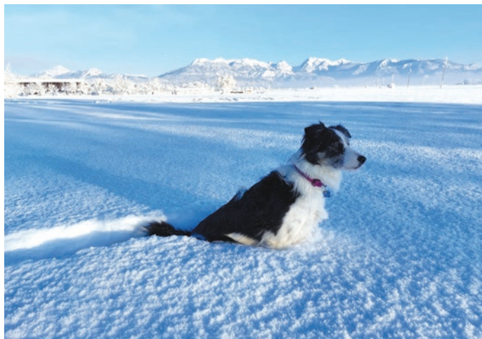
Precej bolj kot ljudje so veseli snega nekatere živali; manj divje, zato pa bolj domače, zlasti psi. Tistih, ki imajo daljšo dlako, namreč tudi pozimi ne zebe.

Kot bi trenil, se je poslovil od nas prvi mesec v letu in hkrati osrednji mesec zimskega meteorološkega trimesečja december–februar. Za zadnjo, tretjo dekada bi lahko rekli, da nas je vsaj za nekaj dni vrnila v »stare« čase, ko je pozimi pogosto padal sneg in je bila naša pokrajina pod snežno odejo. Ta je k počitku prisilila tudi okoliške pašnike, travnike in njive; zlobneži bi dodali, da tudi vse, ki skrbijo za čiščenje oziroma odstranjevanje snega. Tudi letos je bilo to v Trzinu in marsikje drugod »po domače«. V petek, 19. januarja, pa smo jo le dočakali! Zjutraj je dež hitro prešel v sneg do nižin, snežilo pa je še vse dopoldne in na koncu je obležala na tleh več kot 30 centimetrov debela snežna odeja. Temperatura se je z nočnih še skoraj 10 v nekaj več kot dnevu spustila na zavidanja vrednih –12,4 stopinje Celzija. Sobotno jutro je bilo tudi daleč najhladnejše v tej zimi in med najhladnejšimi v zadnjem desetletju (podatkovni niz 2016–2023). Nazadnje se je spustila temperatura zraka pod »desetico« januarja 2019 ter februarja in marca 2018, najhladnejše (–13,8 °C) pa je bilo januarja 2017. Hladen polarni zrak se je iznad nižin osrednje Slovenije umaknil šele prve dni februarja. Najbolj pa ga je pihnilo na novoletno jutro!