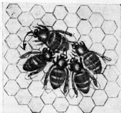
Sl. 5. Čebela pleše »krožni ples«.

V resnici imajo čebele tudi tak alarm na daljavo. Zopet je vonj, ki ga izločajo čebele same! Vsaka delavka nosi namreč s seboj »dišavno stekleničko«. V posebnem kožnem žepku na hrbtu blizu konca zadka izločajo majhne žleze svojstven duh. Nam diši ta izloček po melisi. Poskusi so pokazali, da je ta duh čebelam prijeten, da je močan in deluje že od daleč privlačno na vonjalne organe čebel.