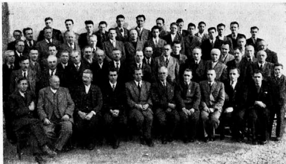
Sestanek vzrejevalcev v Ljubljani 8. novembra 1947