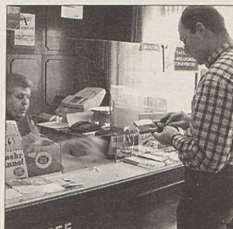
Na pošti v Šentprimožu poslujejo dvojezično.