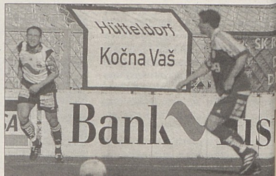
Navijači Rapida so iz protesta proti predsedniku FCK Haiderju razobesili dvojezičen napis.