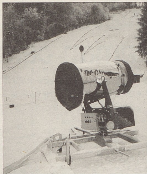
Snežni topovi na Peci letos niso veliko obratovali, ker še ni bilo dovoljenja za zbiralnik vode.