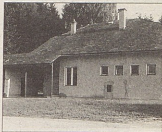
Za ljudsko šolo na Komlju je med kupci veliko zanimanja.

Pliberški občinski možje so prepričani, da bodo dobili višjo ceno, kot jo zahtevajo v razpisu. Denar pa bodo namenili za nakup računalnikov za ljudske šole Božji grob, Vogrče, Libuče in Pliberk.