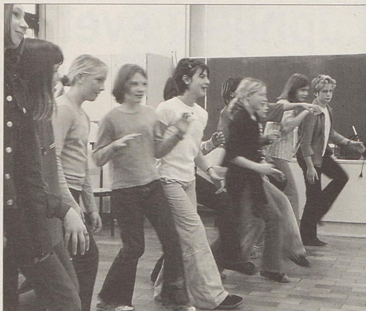
Učenke in učenci na Slovenski gimnaziji so v projektu spoznali najpomembnejše elemente socialnega učenja.

Eden glavnih ciljev je, da učenke in učenci spoznajo razne strategije za premostitev problemov in nenasilno reševanje konfliktov. Učiteljice in učitelji, ki so se aktivno vključili v ta projekt, vsebinsko in metodično na različne načine in z različnimi pristopi vnašajo omenjene vidike v svoj pouk: v obliki raznih kreativnih vaj, primernega dela v skupinah, iger v vlogah, obdelave ustreznih delovnih listov, branja primernih besedil in knjig, razrednih in individualnih pogovorov.