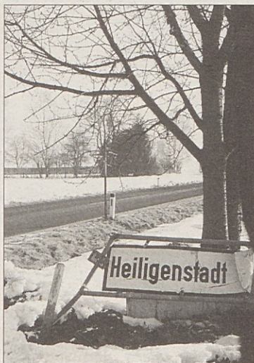
Ena izmed redkih tabel, ki so jo postavili, je bila le enojezična.