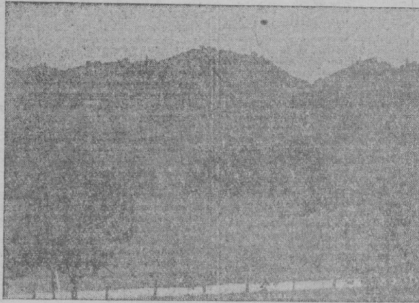
MOTIV IZ HALOZ

nepriznane; bilo je zaneteno sovraštvo med posameznimi verskimi skupinami, kar je pozneje, posebno ob priliki vdora nemških okupatorjev, novili in prešli na pot graditve novega družbenega reda — socializma.