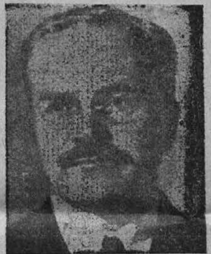
Molotov, ki energično brani naše koristi.

Moskva, 29. maja (Tanjug). — Na letalskem postajališču so sprejeli maršala Tita sovjetski zunanji minister Molotov ter več drugih odličnih osebnosti sovjetskih oblasti ter člani diplomatskega zbora. Tite je podal sledečo izjavo: