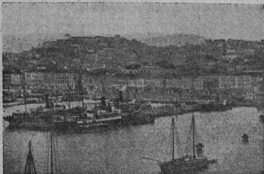
Trst, kateri mora biti naš

Ameriki in na Angleškem pogrešno sodi njej, ker jo primerja ruskemu vzorcu. "Naša borba ima čisto drugačen izvor. Res je, da je naša revolucija po svoji socialni vsebini podobna oktoberski revoluciji, toda s tem še ni rečeno, da je enostavno poanmanje, Klasični vzorec meščanske revolucije proti fevdalizmu je francoska, ki je bila večkrat ponovljena, toda nikdar ne v isti obliki. Mi imamo zopet čisto nove variacije te revolucije.