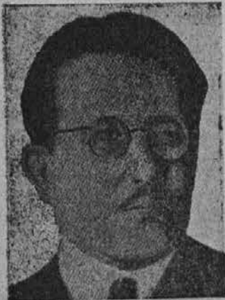
Edvard Kardelj neizprosen boritelj naše Primorske, Istre in Trsta.

Razgovarjal sem se z njim celo uro in izvedel, da je bil vržen v zapor takoj po svo-