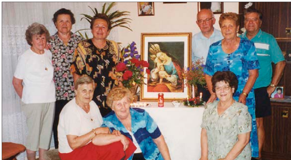
Kapelice s podobo Marije Pomagaj imamo v različnih krajih po Avstraliji. Slovesnosti in romanj se redno udeležujemo.