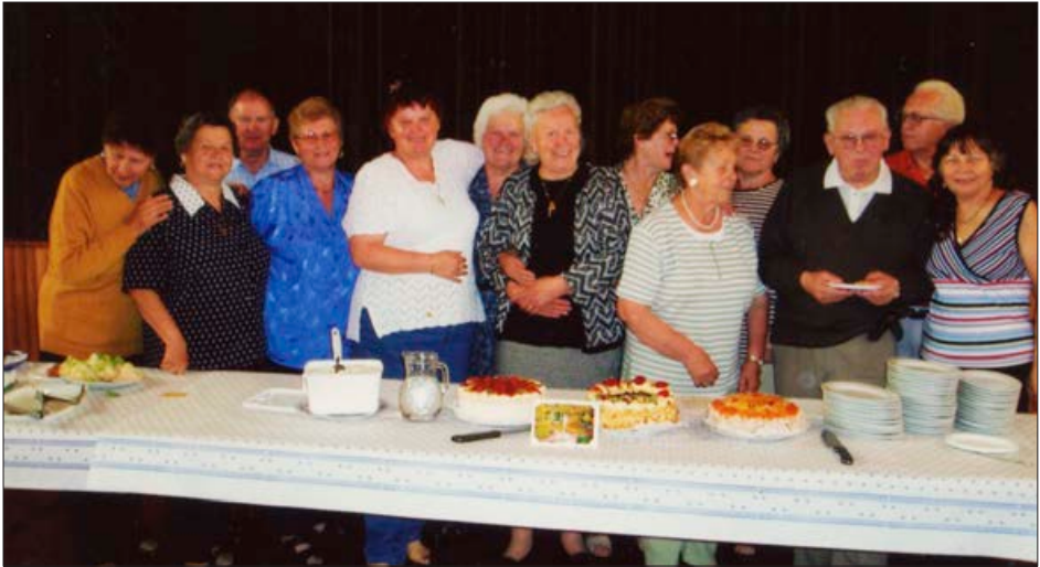
Ob 15. obletnici Molitvene skupine smo se še posebej posladkali

Če se vsak dan zatekaš k Mariji, je dan drugačen, lažje živiš, lažje prenašaš težave, skušnjave itd.