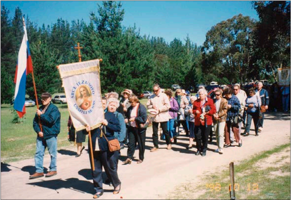
Romarska procesija v Penrose Parku