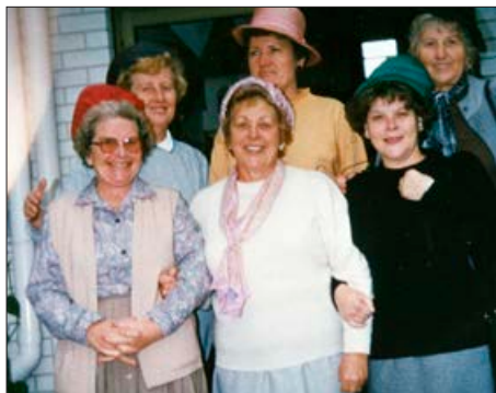
Tudi malo šale in zabave smo si privoščile, ter preizkušale klobuke, ki so bili namenjeni za prodajo na "garage sale".