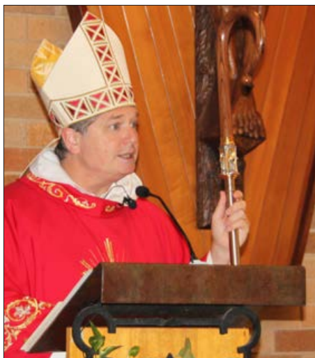
Msgr. dr. Anthony Fisher OP, naš škof v Par- ramatti, je bil 18.9.2014 imenovan za novega nadškofa metropolita v Sydneyu. Lani, 13.10., je vodil pri Sv. Rafaeu v Merrylandsu slovesnost ob 40-letnici blagoslova naše cerkve in birmoval.

Zahvaljujemo se vsem, ki ste pomagali pri izdaji nove številke »Rafaela«. Hvala tudi vsem, ki ste ali še boste dali svoj dar slovenski cerkvi sv.Rafaela, kot pomoč za vzdrževanje cerkve in dvorane.