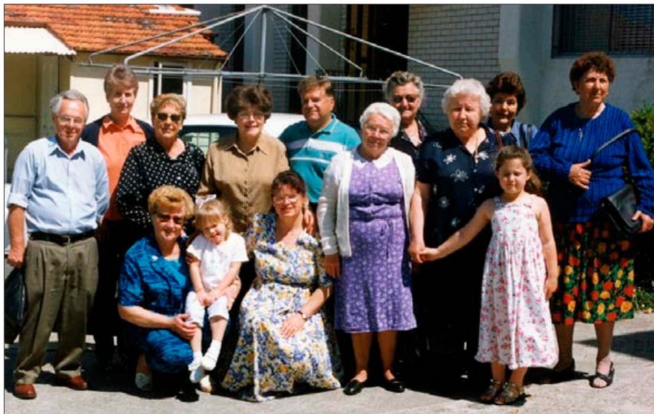
Pred obedom v dvorani, po molitvah in po sv. maši smo se zbrali pred cerkvijo, kar tako, za spomin.