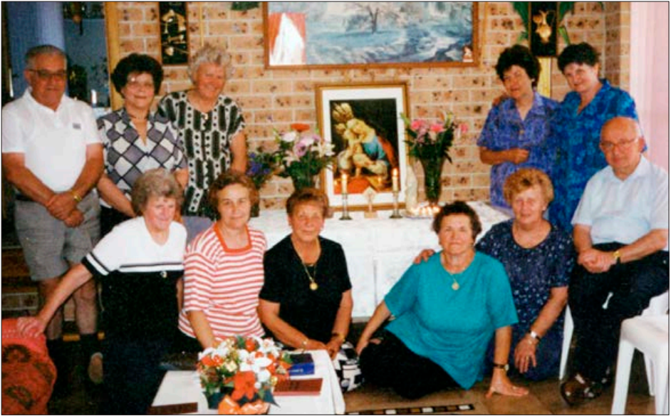
V mesecu maju v času šmarničnih pobožnosti imamo včasih pobožnosti ob kipu Fatimske Matere Božje ali pa ob sliki Marije Pomagaj z Brezjij na naših domovih.