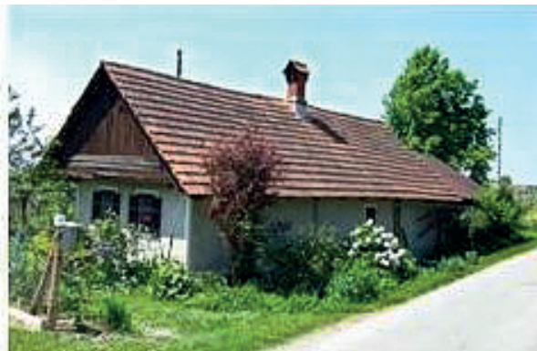
Stara in novejša zidanica.

Stanovanjska oprema v viničarski hiši je bila skromna in revna. V kuhinji so imeli štedilnik, mizo, nekaj »kaslov« (predalnikov), v sobi sta bili po navadi dve postelji. Otroci so spali na eni postelji, kar trije do štirje na eni, ali pa na krušni peči. Tudi mož in žena sta spala v tej sobi, včasih tudi širše sorodstvo. Postelje so bile napolnjene s slamo, pokrival oziroma odej niso poznali. V mrzlih zimskih nočeh so se pokrivali s suknjami.