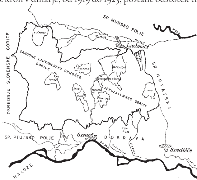
Skica Jeruzalemskih goric.

Tako so viničarji Jeruzalemskih goric v obdobju med obema vojnama v že omenjenih hranilnicah in posojilnicah najeli skupaj 38 kreditov. Približno 66 % so jih uporabili za nakup živine, 34 % pa za potrebe gospodarstva. Dva kredita sta bila najeta za nakup šivalnih strojev.