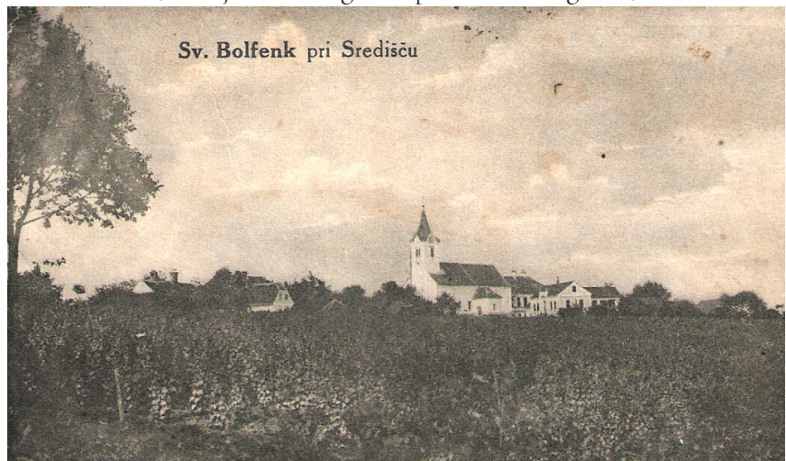
Stara razglednica Koga.

Zato najdejo fevdalci v 16. stoletju izhod v tem, da se vinogradi spremenijo v pravdno zemljišče toliko časa, kot traja naselitev. Tako postane gorskopravno kajžarstvo podložno. Primarno socialno plast v vinskih goricah tako