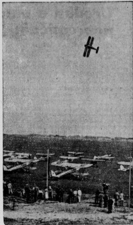
Nizozemska dobi novo letališče. V prisotnosti raznih inozemskih letalcev, so slovesno otvorili nizozemsko letališče Ypenburg.

Potem smo dobili kitajski guljaž s kolerabo, ki je bila v vinu kuhana in pa dušen, kitajski kruh. Sledili so golobčki, vkuhani ko mezgá, zraven pa tenke rezine teletine, ki so jih prej po-