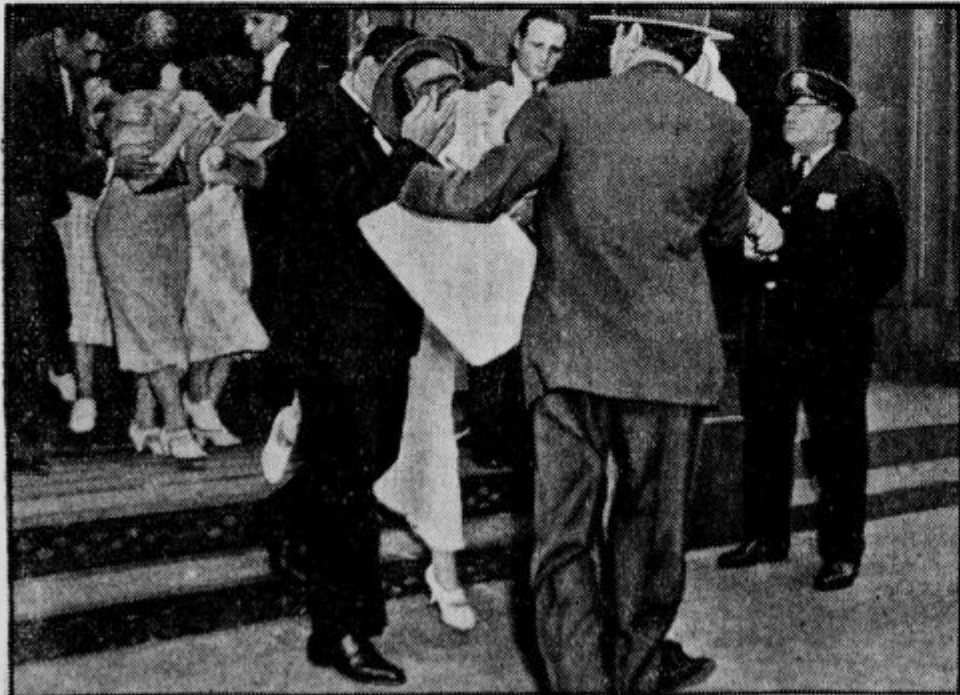
Komunisti in komunistke, ki so nedavno povzročili nemire na ladji »Bremens«, preden se je odpeljala, v njujorskem pristanišču, pa so jih koj prijeli, si skrivajo obraz, da bi jih ne fotografirali.

ki je skoraj takšno ko Jugoslavija. Ti ljudje se bavijo z živinorejo, so pastirji in tudi roparji in v nekaterih delih dežele je celo nekaj polja. Edina večja naselišča, edino bogastvo te bedne dežele je potres leta 1931 in 1935 močno poškodoval. Predvsem je trpelo mesto Quetta na severu, ki je Sven Hedin dejal o njem, da je ko paradiz spriču vseh onih peščenih gričev, pustinj, žgočih pečin, konicastih granitnih stožcev, divje, razburkane prirode, kakršno je drugod po teh krajih. Quetta, utrjeno mesto, leži 1700 m nad morjem in ima še precej znosno ozračje. V Quetti so bili lepi vrtovi, krasne vile in trgovine. V tem paradizu je potres strahotno divjal. Leta 1935 je bila Quetta popolnoma porušena. V vsej deželi je umrlo radi potresa 30.000 ljudi. Vendar, ker je človek navezan na lastno grudo, so Quetto iznova pozidali na istem mestu ko prej, a hiše bodo drugače sestavljene, da bodo radi potresne nevarnosti bolj prožne. Quetta je torišče za obrambo Zahodne Indije. Novo mesto bo stalo o milijonov funtov šterlingov.