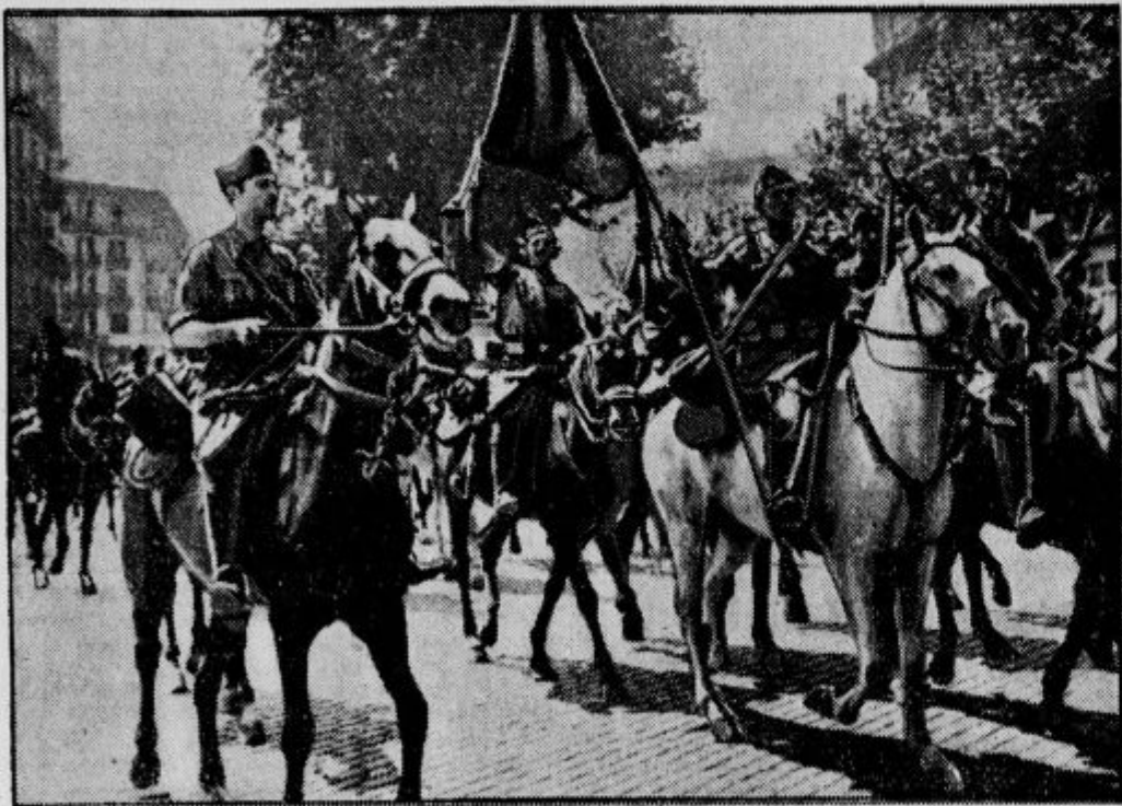
Rdeča konjenica se odpravlja na bojišče. Rdeča konjenica na barcelonskih cestah, preden je odšla pred Saragoso.

Dalje poročajo, da so rdeči miličniki v romarski cerkvi na Montserratu vse razrušili, karkoli kaj spominja na vero. Razumemo bistvo takšnega strahotnega dejanja: v Španiji hočejo zatreti vsakršni spomin na vero, da bi deželo pripravili za sprejem komunizma. Marksisti se dobro zavedajo, da je vera v ercu ljudstva, ki še ni okuženo marksistično, trdo in globoko ustaljena. Zato morajo pač najprej porušiti ta trdni temelji, da bodo mogli na njegovo mesto postaviti boljševisično mišljenje. Zavedajo se, da je verni človek tisti človek, ki zna