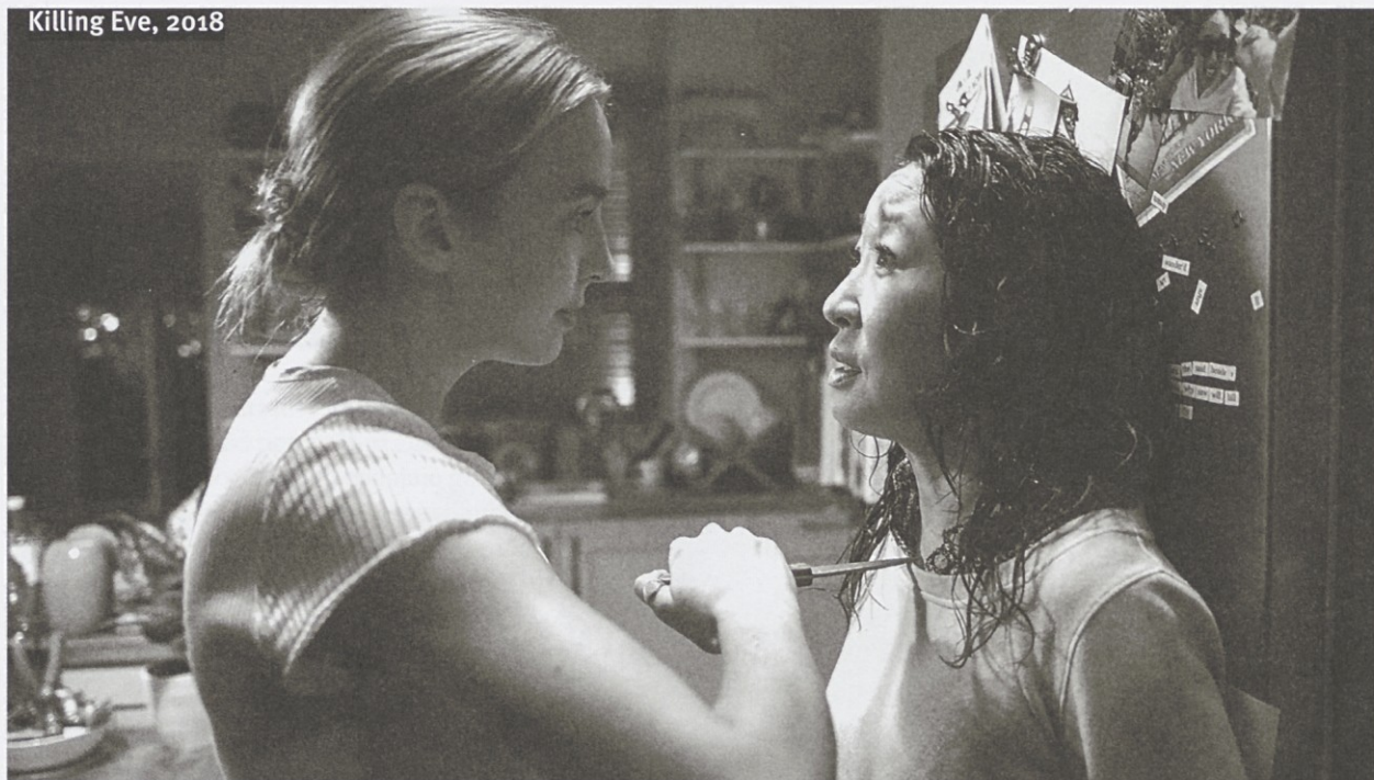
Killing Eve, 2018