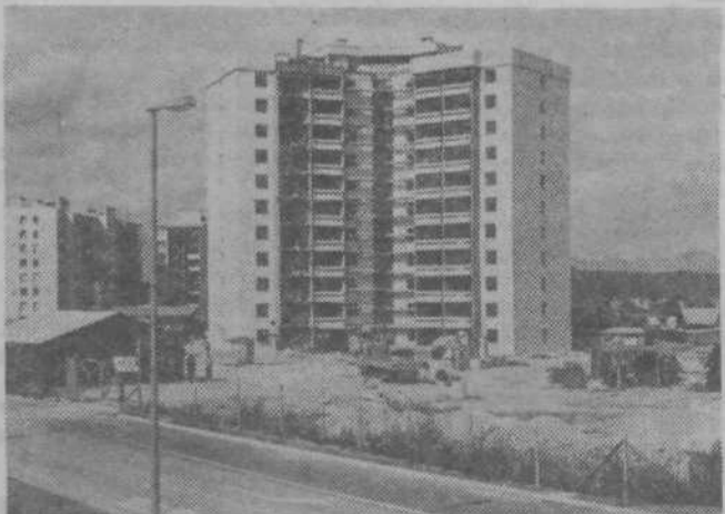
Delavci Gradisa zaključujejo gradnjo dveh 10-nadstropnih stolpnih J1 in J2