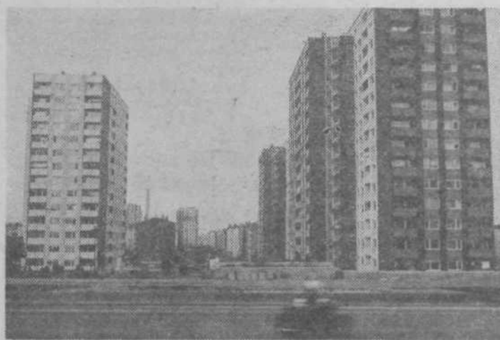
Mudi se