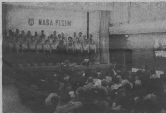
Z letošnjega koncerta vevških pevcev v kulturnem domu na Vevčah