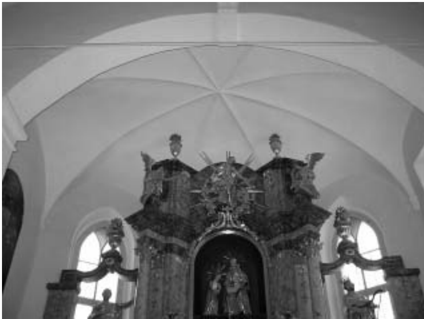
Sl. 6: p. c. sv. Ane, Slovenske Konjice, obok prezbiterijske ladje

daje vtis centralne arhitekture. Prezbiterij je od ladje ločen s slavolokom, ki ima stranice posnete s sodobno varianto paličastega motiva, vrh pa krasijo volute. Tudi prezbiterij kljub svoji kratkosti deluje zelo prostorno, obok je prav tako kot ladijski okrašen s preprostimi grebeni, ki slonijo na konzolah (sl. 6). Na zahodni del ladje je prislonjena empora, ki bi jo verjetno zaradi rahle neskladnosti z ladijskim prostorom (ograjja se neposrečno izteka nad okenske okvire) in enakih renesančnih stebrov v pritličju, kot se pojavljajo na novejšem delu zunanje lope, morali že postaviti v 17. stoletje. 10 Prvotna oprema se ni ohranila. 11 S svojimi elementi, kot so šilasta okna in ločni zidec, se cerkev močno navezuje na dele ž. c. sv. Kunigunde v Gorenju nad Zrečami iz 16. stoletja. 12 Cerkev je bila kasneje prezidana, več o njeni povezavi s konjiško cerkvijo pa bi brez dvoma odkrile primerne raziskave.