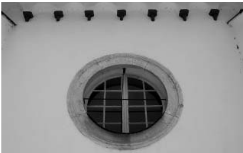
Sl. 4: p. c. sv. Ane, Slovenske Konjice, ladijsko okno z zidcem

najverjetneje uporabili tudi nekaj starejših arhitekturnih členov. 7 Na pročelju lope je vzdian grb družine Khisl (sl. 3). Južna kapela sv. Florijana in zakristija sta iz 18. stoletja, pokopališče pa so ob kapelo prestavili šele v 19. stoletju. 8