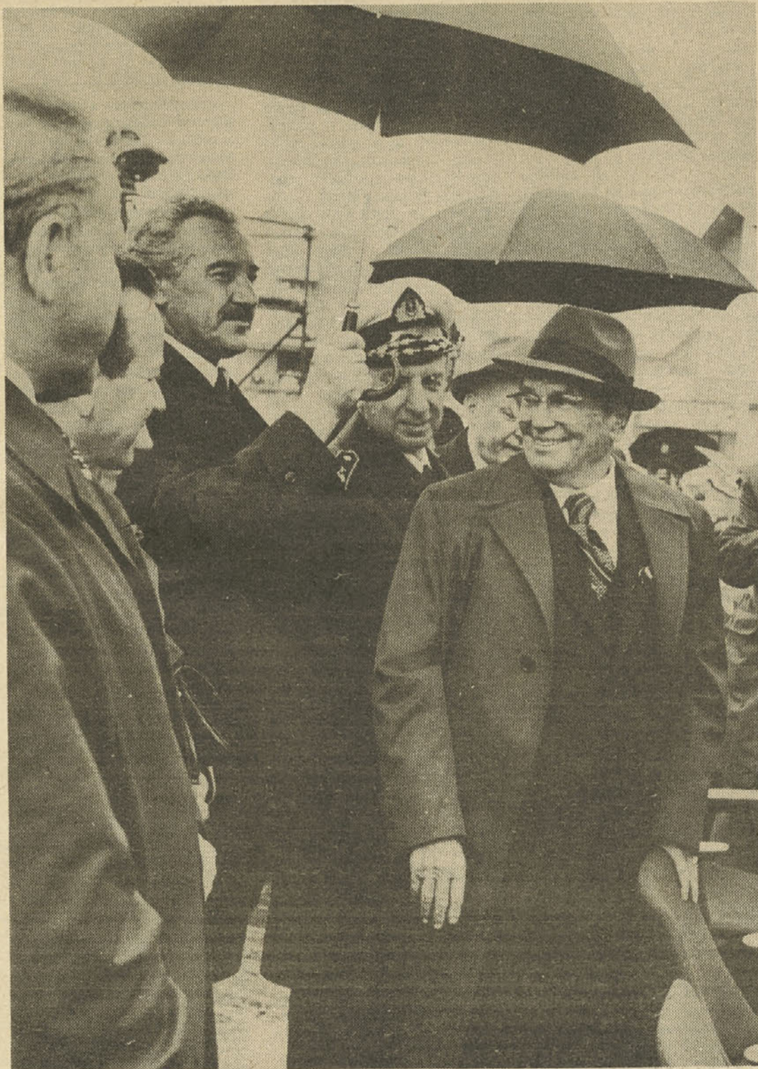
Z nasmehom in ustvarjalno v prihodnost...

Sedemdesetletnik, vedro nasmejan, pokončen kot hrast, je prav zaradi ustvarjalnega dela, ki podaljšuje mladost, resnično lahko z gled mladim in drugim, je neizčrpen zgled mladostne zagnanosti in življenjskega optimizma, prav s tem pa vodilo samoupravni vzgoji, ki jo je treba razviti, tako da bomo zmogli ohraniti srečno mladost in dejavnost v tovarnah, v šolah, v družinah, ob vsakdanjih medsebojnih srečanjih. Mladina je naše največje bogastvo, je naša prihodnost. Srečna bo le, če bo znala delati. L.R.