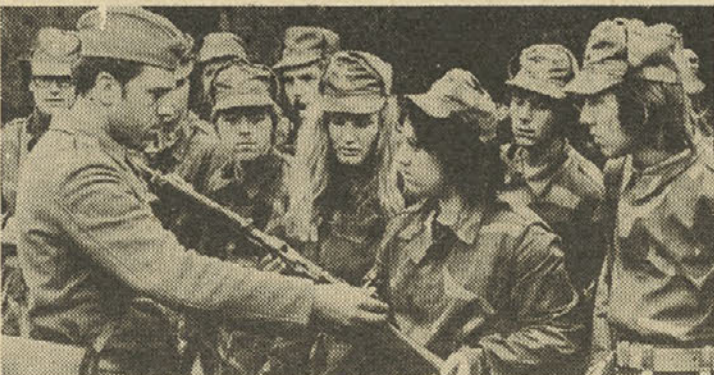
Mladi se usposabljaajo za obrambo