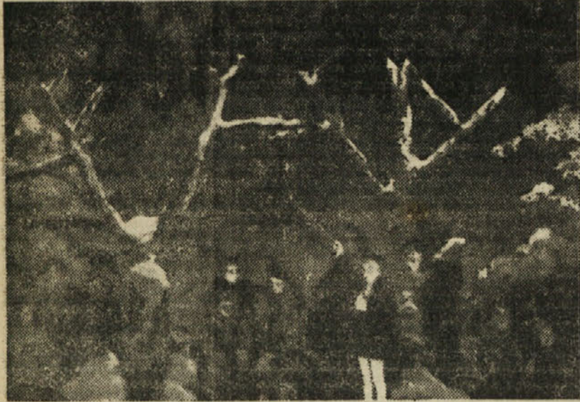
Zaključna scena III. dejanja

Pionirsko gledališče se je borilo s težavami zaradi naprave oblek, česar pa so ga rešile tovarišice iz trbovelj-