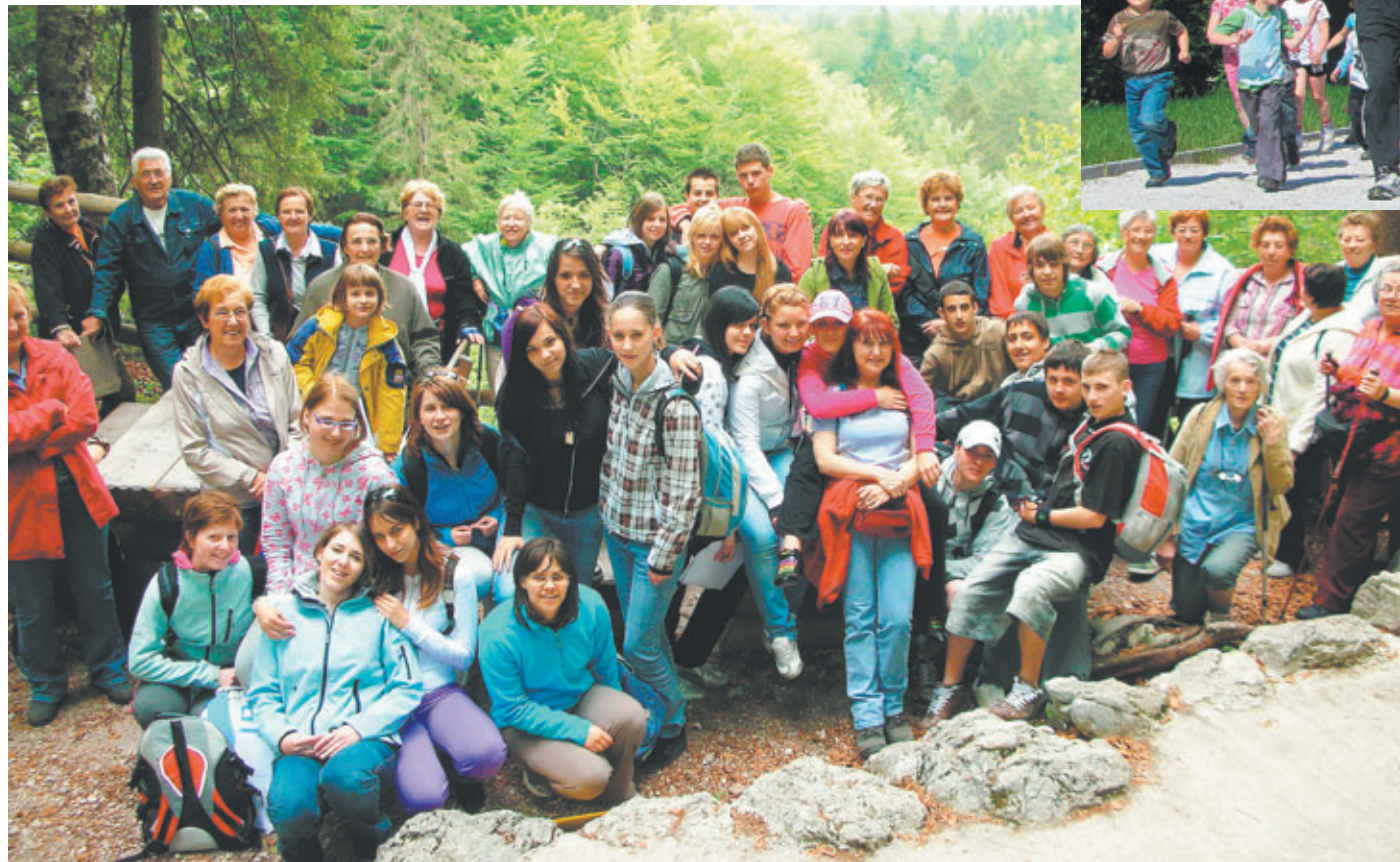
Skupni projektni dan dijakin in učiteljev ŠCRM ter Društva upokojencev Kamnik je navdušil dve oziroma tri generacije. Takole smo uživali pri slapu Savica v Bohinju.

Vse dejavnosti ŠCRM na projektu smo razdelili na tri področja glede na starostno skupino udeležencev, s katerimi smo izvajali določeno aktivnost. Sodelovali smo z VVZ