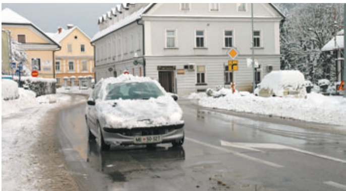
Na drugi strani pa se najdejo tudi brezvestni vozniki, ki s svojo malomarnostjo ogrožajo varnost v prometu.