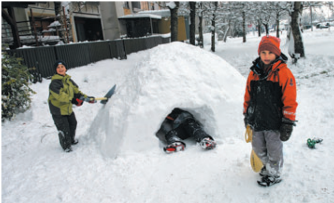
Pred blokom na Zikovi so otroci zgradili iglu.

Letošnja zima nas nikakor noče razveseliti z novo pošiljko snega, ki si jo želijo predvsem otroci in ljubitelji zimskih športov. Že več kot mesec dni je minilo od zadnjega obilnega sneženja, ko so otroci iz snega lahko zgradili čisto pravi iglu, starši pa so jih prevažali po mestu kar na sankah ... Kolikor veselja in radosti je v soboto, 18. decembra, sneg prinesel otrokom, toliko dela so na drugi strani imeli odrasli s kidanjem snega z dvorišč in pločnikov, čiščenjem avtomobilov. No, nekateri si niso dali kaj dosti opraviti s snegom in so se na pot podali zgolj z očiščenim vetrobranskim steklom.