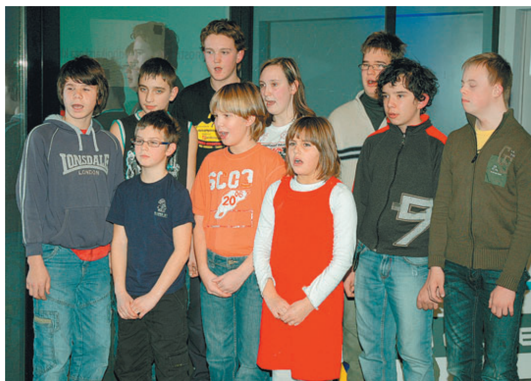
V OŠ 27. julij se že od leta 1982 šolajo otroci s posebnimi potrebami. Trenutno imajo 25 učencev, starih med 7 in 19 let. Kot se lahko prepričamo ob vsakem srečanju z njimi, je to šola prijaznih ljudi, ki že dobrega četrta stoletja z občutkom, spoštovanjem in tudi z ljubeznijo vzgaja in izobražuje otroke za lažjo, zmerno in težjo motnjo v duševnem razvoju. Tokrat so pripravili prigriscni pevski nastop.

»Vesel sem, da se je klub v slovenski prostor spustil ne samo skozi odbojko, ampak