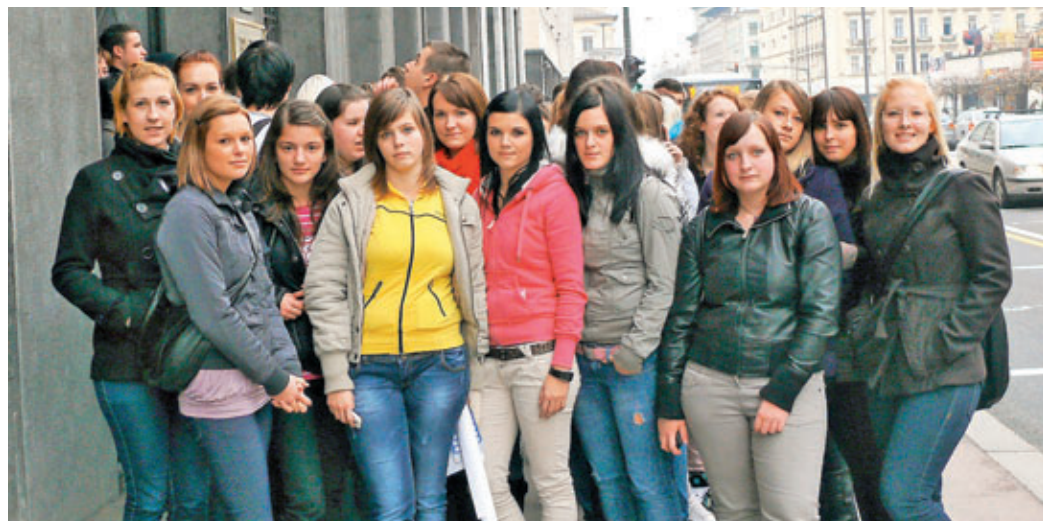
Pred vhodom v Banko Slovenije.

Z dijaki četrtega letnika srednje ekonomske šole smo v sredo, 17. novembra, spoznali strokovne teoretične vsebine na terenu. Zapeljali smo se v Ljubljano, kjer so nam svoja vrata najprej odprli na Poštnem centru. Tam smo si ogledali pot in sortiranje ter