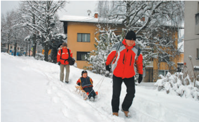
Užitki zimskih radosti tudi s sankami.