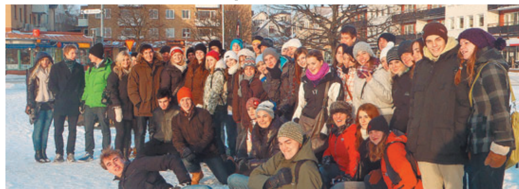
V Waxholmu, nato z ladjico v Stockholm.

Z avtobusom smo se nato odpeljali do Tabyja, 25 km severno od Stockholma, kjer so nas že pričakali švedski dijaki. Šola je veliko večja kot naša, po hodnikih imajo sedežne garniture, kantino, televizijo, imajo tudi računalnico ter posebno sobo za učenje. Učenci so bolj organizirani, pa tudi učitelji so bolj pripravljeni sodelovati z njimi. Po kosilu smo odšli peš do športne dvorane, kjer smo se s švedskimi dijaki