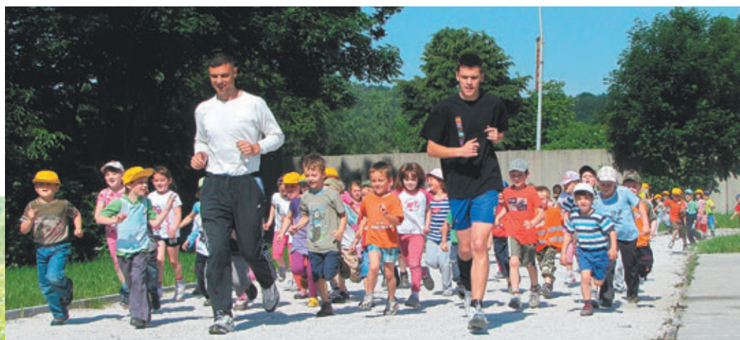
Dejavnosti dijakov in zaposlenih na ŠCRM s skupinami VVZ Antona Medveda so bile predvsem športno obarvane.

Antona Medveda, OŠ Radomlje, OŠ Roje – ŠPP in Društvom upokojencev Kamnik.