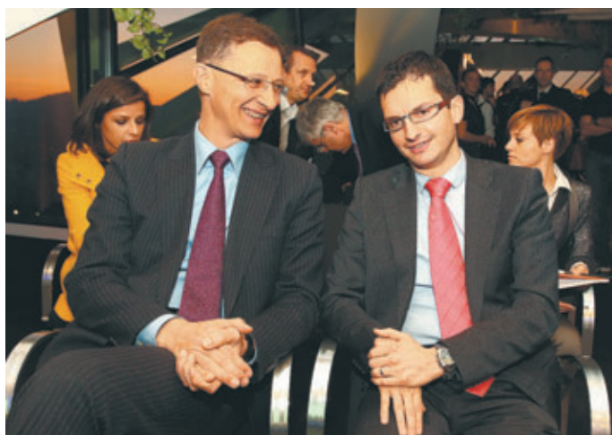
Podporo dobrodelni akciji Podaj žogo sta izrazila tudi minister za šolstvo in šport dr. Igor Lukšič in župan občine Kamnik Marjan Šarec.

Obiskovalci so si ob tej priložnosti ogledali slike in lahko odkupili tiste, ki še niso bile oddane. Za podporo akciji so se odločila številna slovenska podjetja in za učence osnovne šole zbrala že preko dva tisoč evrov.