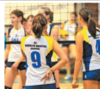
poraza in zmagujejo tudi z razliko 102 točk.

V Šolskem Centru Rudolfa Maistra Kamnik imamo veliko dijakinj in dijakov, ki so talentirani športniki. Zasluga športnih pedagogov in sodelovanje z odbojki klubom Calcit Kamnik je recept za odličan začetek v ligi, saj smo zaenkrat v prvem delu tekmovanja pri dijakih zabeležili tri zmage in le en poraz, ki se je izkazal za motivacijskega, istega nasprotnika iz Kranja smo namreč na povratni tekmi premagali z gromozansko razliko. Dijakinje pa so še boljše, saj se niso okusile grenkobe