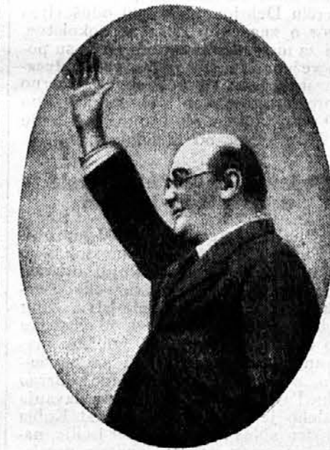
Dr. Janez Ev. Krek

Dne 8 okt. pred 15 godina umro je dr. Janez Ev. Krek*, jedan od najvećih širitelja i propovednika slovenačke misli u jugoslovenskom smeru, neustrašivi borac za narodne ideale, koji se nije bojao da progovori reč za domaću stvar također ni na najvišem mestu.