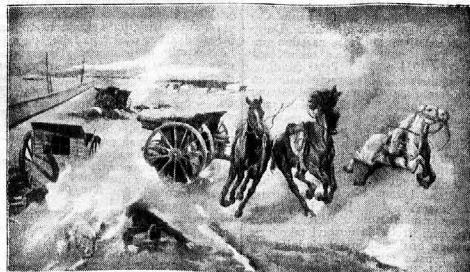
Iz borbe kod Kumanova: srpske granate uništavaju turske baterije

S bugarskom pak bila je Srbija u neprijateljstvu već od nesrećnog bratoubilačkog rata 1885 godine, koji je započeo Milan na pobudu Beča, te kao austrijski štitonoša vadio iz vatre kstenje za bečku i budimpeštansku gospodu. Naravno, povećanje Bugarske, koja je bila ruska štitičnica, nije bilo u prilog »Dranga nach Osten«, jer je Bugarska, kao povećana Rusija na Egejskom Moru, rusila most prema Indiji. Zato su i nahuškali Milana, tobo-