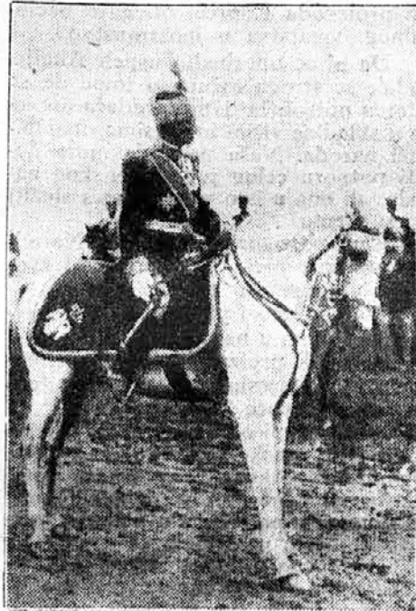
Kralj Petar I