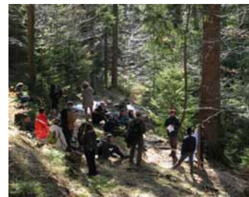
Ogled Sgermove smreke.

gozdar, s katerim smo bili domenjeni, pustil na cedilu. K sreči sami dovolj dobro poznamo Logarsko dolino, da smo jo lahko razkazali in skupaj občudovali še delno zamrznjen slap Rinka. Za popoldan pa smo se dogovorili z domačinom Plesnikom, ki nam je z veseljem razkazal sodobno kurilnico lesnih sekancev, ki ogrevajo velik del objektov v Logarski dolini.