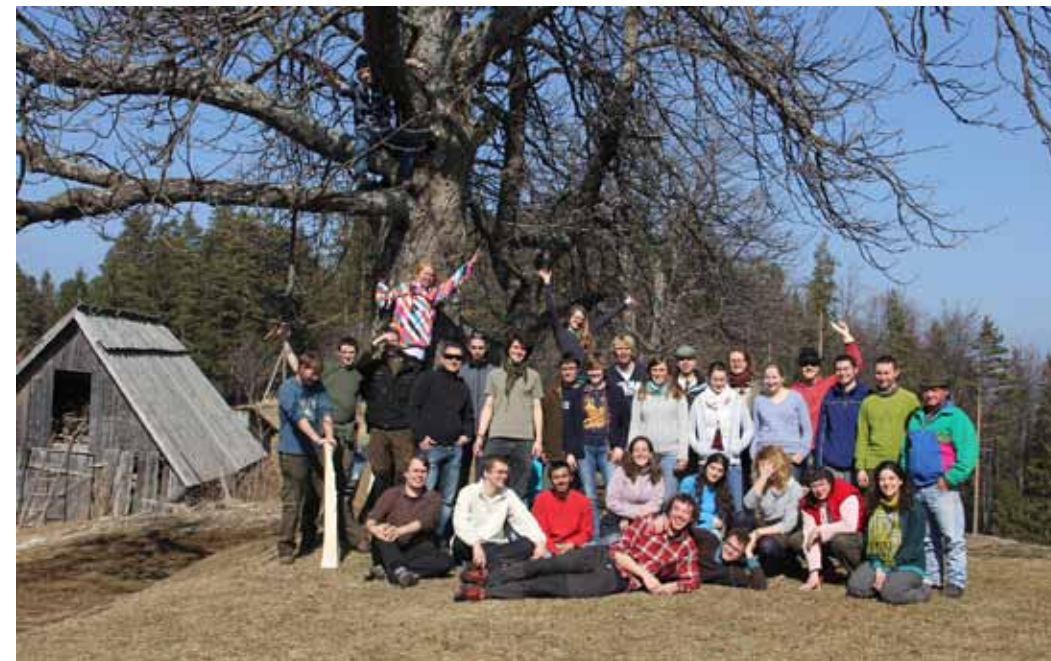
Skupinska fotografija pred kočico na Pesniku; fotografiral Jakob Horl.

Do večera smo okoli Pohorja prišli v Slovenske Konjice, kjer smo preživeli četrtkovo noč, v petek zjutraj pa smo bili že na Gradu na Goričkem. Tam smo bili deležni predstavitve največjega gradu v Sloveniji ter življenja tamkajšnjih ljudi. Po kosilu