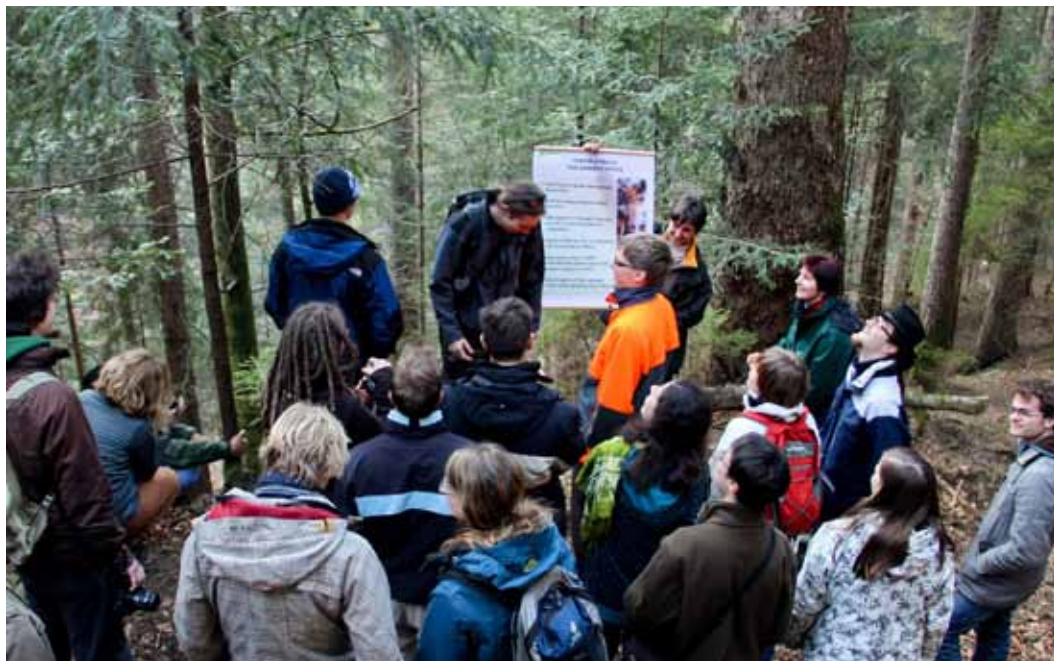
Voden ogled po Pahernikovih gozdovih.

Jutro je v Logarsko dolino prineslo precejšnje razočaranje, ko smo izvedeli, da nas je revirni