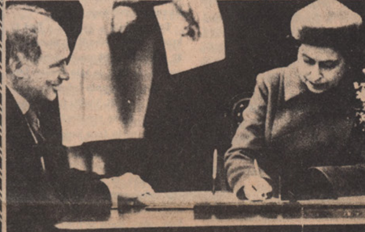
Važen moment v zgodovini nove Kanade. Ministrski predsednik P.E. Trudeau prisostvuje kraljičinemu podpisu dolgo pričakovane nove kanadske ustave.