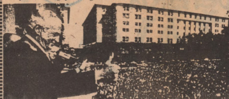
Predsednik Argentinske vlade general L. Galtieri govori v Buenos Airesu.

Spor med Anglijo in Argentino za Falklandske otoke.