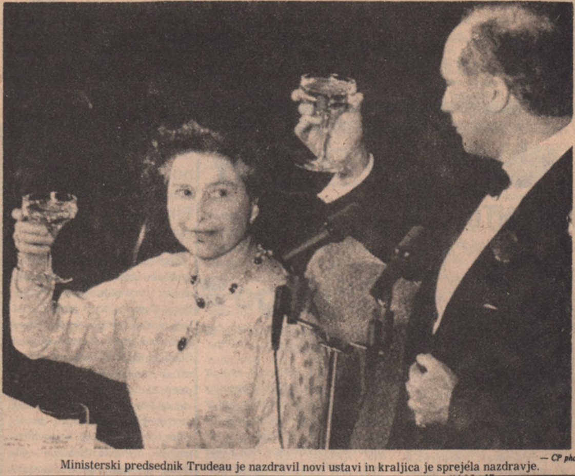
Ministrski predsednik Trudeau je nazdravil novi ustavi in kraljica je sprejela nazdravje.

Po ogledu šole, je predsednik iste vse pozdravil, odgovoril pa mu je in se zahvalil za gostolubje predsednik novinarske organizacije naš urednik! Za zaključek so vse goste pogostili s kosilom.