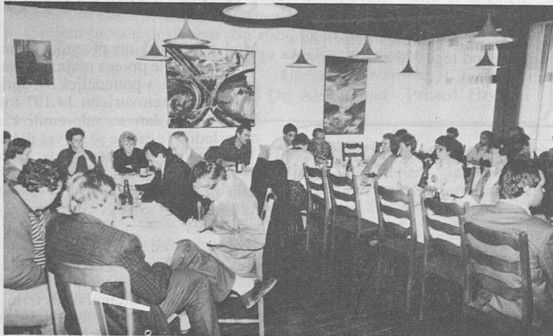
Konferenca sindikata, na kateri je bil ustanovljen sindikat pristaniških delavcev