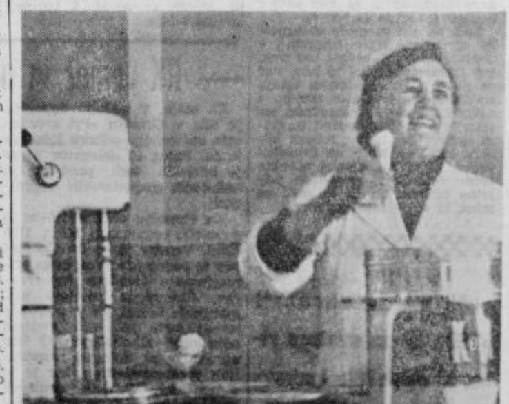
Dober siadoled in prijazen nasmeh v slaščičarni v Kidričevem