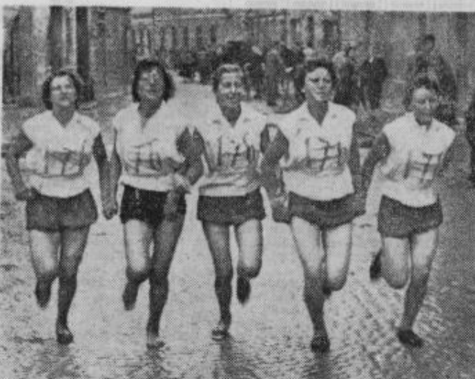
Dekleta se bližajo cilju pohoda

Komisija za sklepanje in od-povedovanje delovnih razmerij pri kmetijski zadrugi »Ha sac«, Ptuj, razpisuje naslednji prosti mesti: 1. administratorke 2. fakturistke Pogoji pod: 1. diplomant ekonomske srednje šole ali administrativne šole z dobrim znanjem strojepisja, ter nekaj prakse. 2. administrativna šola z znanjem strojepisja. Osebnih dohodkov po pravilniku o delitvi osebnih dohodkov. Prijave pošljite na naslov: KZ »Haloz«, Ptuj. Razpis velja do zasedbe delovnih mest.