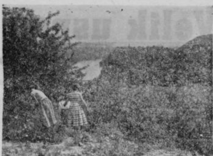
Pogled na letovišče grad Borl