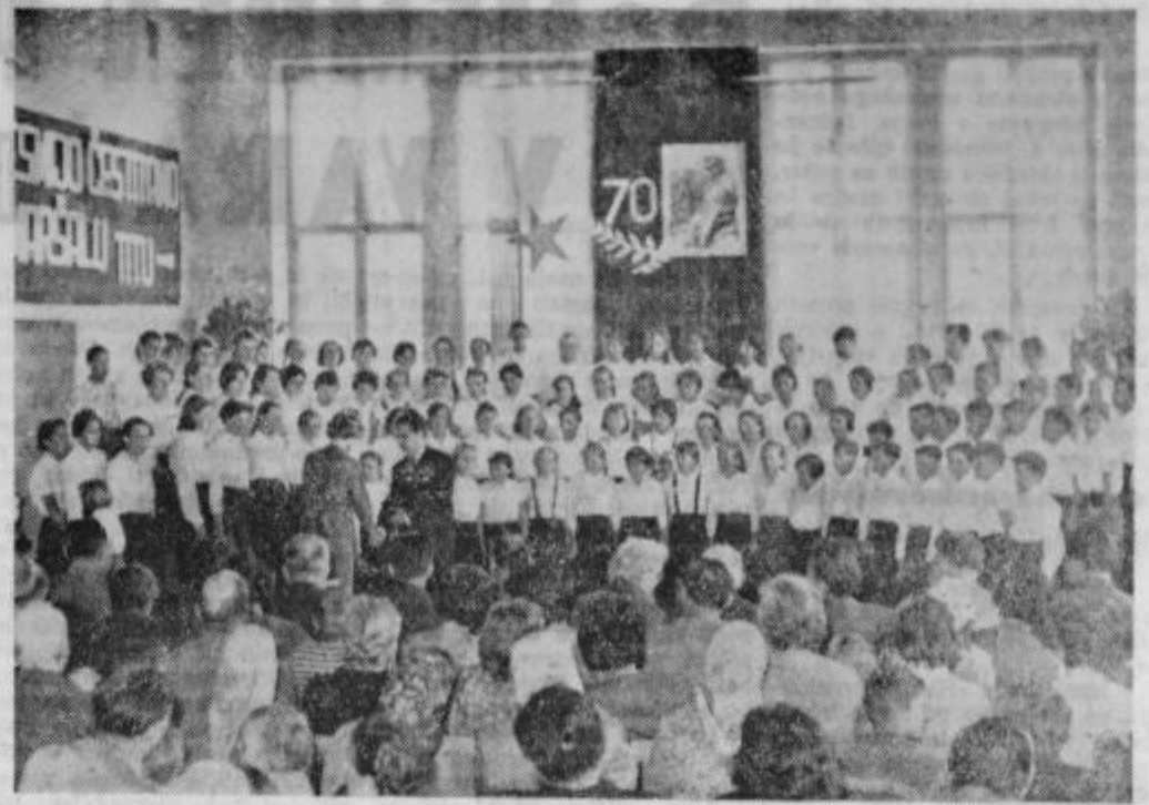
Pevci iz osnovne šole »Franca Belšaka« v Gorišnici