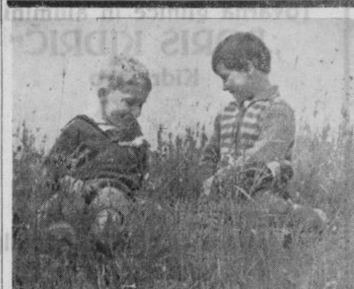
Cvetka ti marjetica, povej, če — rada me ima

»Tednik« izhaja pod tem skrajšanim imenom od 24. nov. 1961 dalje na predlog Občinskih odborov SZDL Ptuj in Ormož