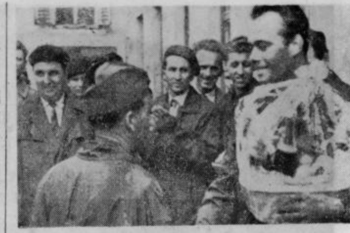
Razdelitev nagrad po pohodu

Kino Zavre predvaja 3. junija t. l. jugoslovanski film »KOZCEK MODREGA NEBA«.