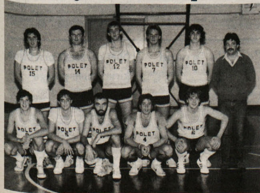
Poletovci so v promocijski ligi doslej osvojili tri zmage