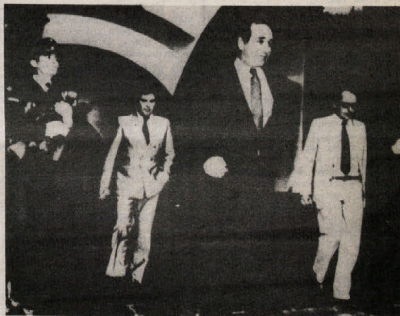
Čilski zunanji minister Miguel Schweitzer zapušča svoje mesto po komaj 10 mesecih od imenovanja. V zadnjih 10 letih je tako Pinochetova strahovlada izgubila že petega šefa diplomacije