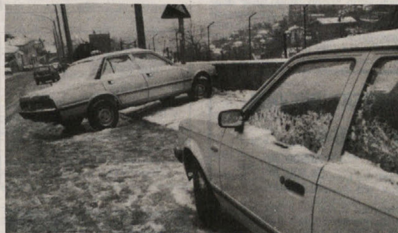
Tovrstnih prizorov je bilo včeraj zjutraj na Ul. Commerciale veliko

lanska cesta. Pri Rumeni hiši je namreč tovrnjak zaneslo v hišo. Mestni redarji so cesto zaprli od 7. ure do 10.30 in preusmerili promet na druge ceste. Skupno so mestni redarji zabeležili kakih deset manjših prometnih nesreč, brez ranjenih, mnogo več pa je bilo avtomobilistov, ki jim je avto zaneslo s ceste in so ga morali kar na lepem pustiti ob cesti.