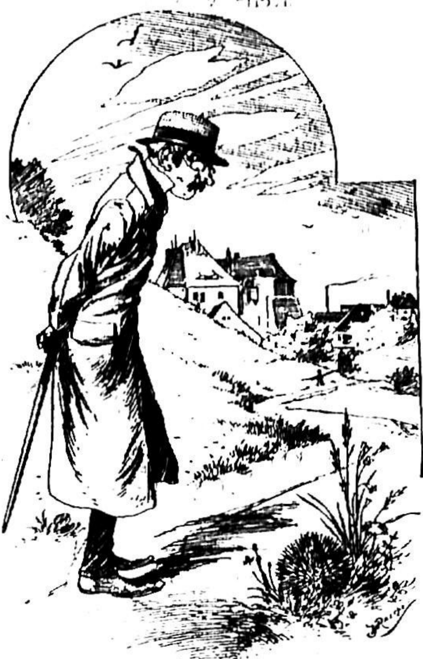
ŽUPAN. »Sramota«! Tone in naš Nace sta se slepla v go- stilni. In mesto, da bi bil ubit vrček, se je Nacetu razbila glava. Sramota zame in za celo občino.»