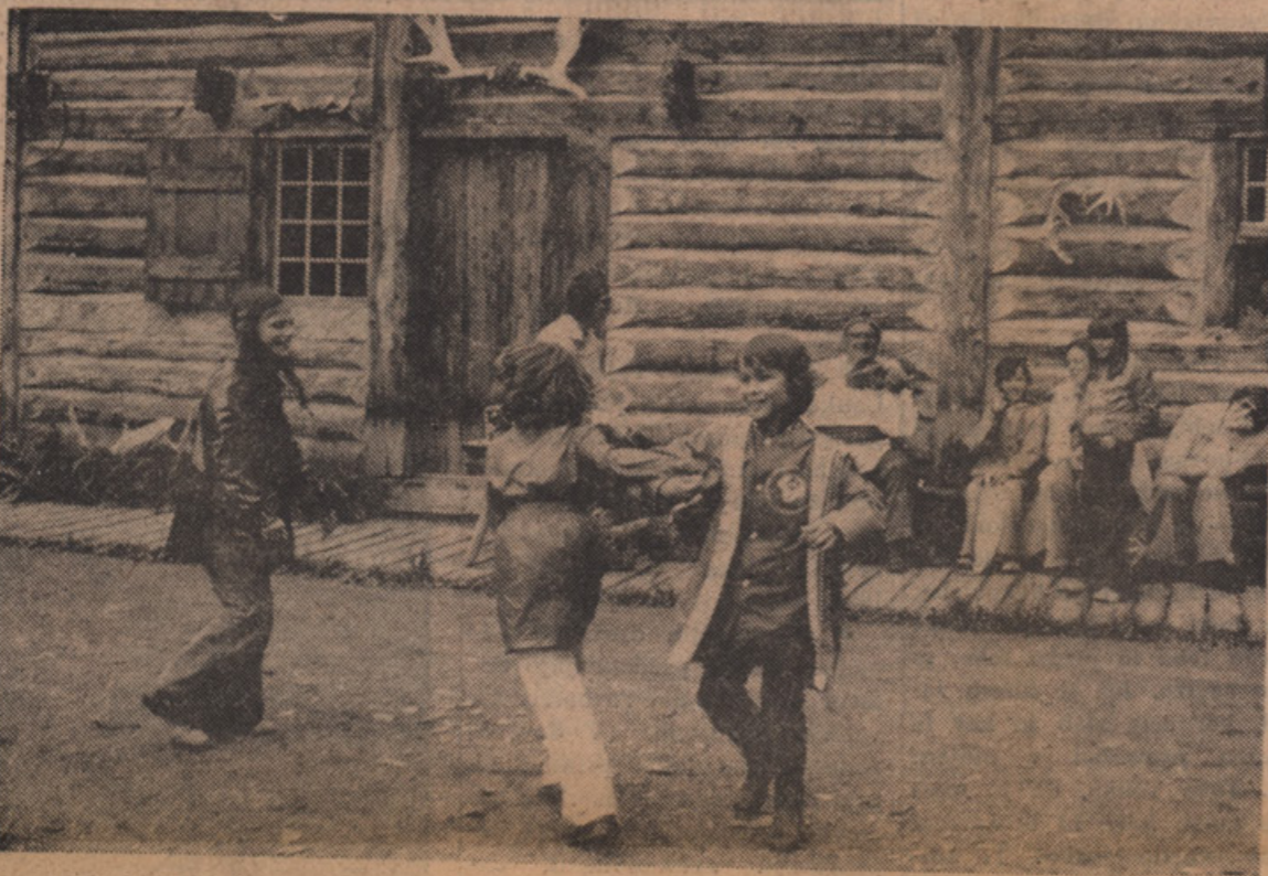
OTROCI SO OB ZVOKIH VIOLINE ZAPLE SALI "KVADRILJO" (SQUARE DANCE).