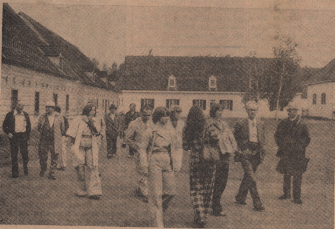
UREDNIKI ETNICNIH LISTOV NA OGLEDU TRŽISČA