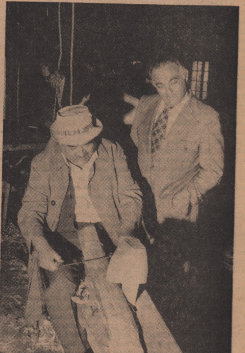
Naš urednik je "spoznal" "stroj" iz stare domovine, kot ga je uporabljal njegov stari oče v Sloveniji.