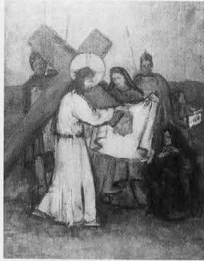
VI. postaja: Veronika poda Jezusu potni prt