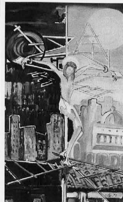
Ena izmed objavljenih slik: Križani Kristus na televizijskih antenah