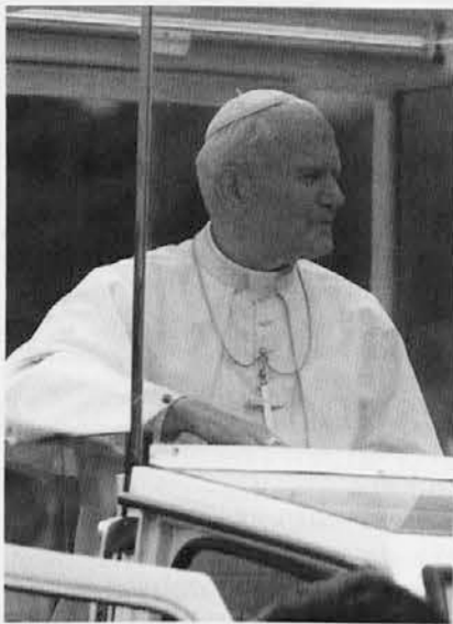
Papež med obiskom v naši deželi

Dobro bi bilo, ko bi bil v pripravljalnem odboru tudi predstavnik iz zamejstva.