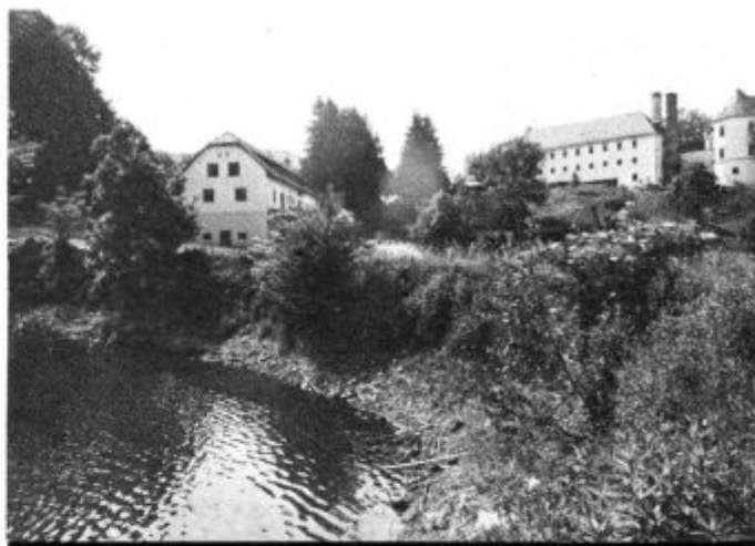
Jeseni o mračnih dogodkih iz maja 1945

— od ponedeljka do petka od 9.00 do 17.00 ure — v soboto od 9.00 do 12.00 ure