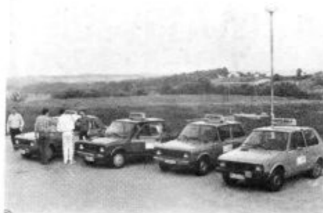
DOBRODOŠLI V NAŠI AVTO ŠOLI — MAJ 1990 —

ena temeljnih nalog izobraževanja in vzgoje v mladosti je pripraviti človeka na to, da se bo želel in znal izobraževati tudi potem, ko konča svoje začetno izobraževanje v šoli.