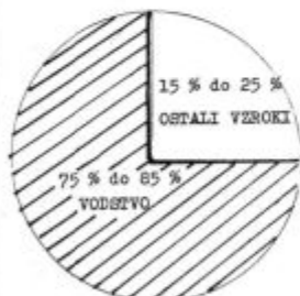
DELEŽ ODGOVORNOSTI ZA NEUSPEH

Po rezultatih raziskav svetovnih ekspertov vodenja oziroma poslovodenja je za slabo poslovanje v največjem deležu krivo prav vodstvo organizacije.