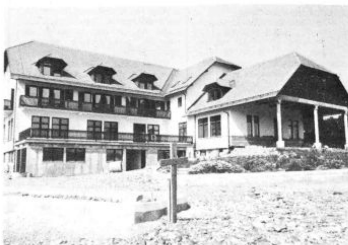
AGATA: KDO BO TEBE LJUBIL?