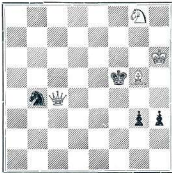
Mat v tretji potezi.