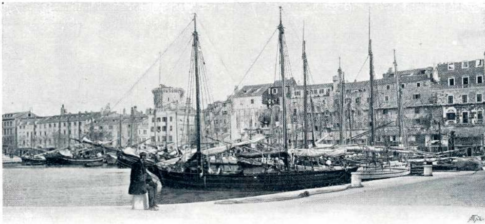
SPLIT: STARI BREG

bruskega († 31. maja 1907), ki je zasnoval in ustanovil slog „češki šahovski šoli za naloge“. Izvajanju prireditelja: „Slovo Dobruskeho ve věcch šachových bylo u nas vždy rozhodující, jeho náhledu a úsudku podrobili jsme se vždy všichni“, ne bo nihče oporekal, ampak slovesno pritrđil. Zbirka obsega 244 nalog in stane nevezana 3 krone. Slovenski šaholjubi sezite po njej, gotovo Vam ne bo žal. V založništvu Numa Preti v Parizu (Rue Saint Sauveur 72) je izdal znani mecen Olain C. White zbirko: Les mille et un mats inverses (1001 samomatov) v 2 lepo vezanih delih. Staneta oba dela 6 frankov. Cena ni visoka — zbirko samomatov, ki niso „les fleurs de serre“ priporočamo prijateljem des „mats inverses“.