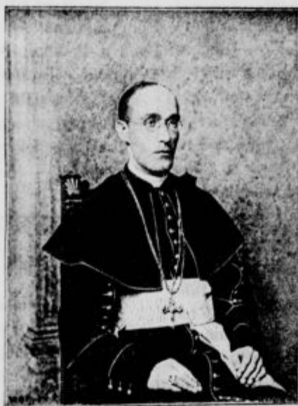
Knezoškof dr. Mihael Napotnik

Javna predavanja prične zopet prirejati »Slovenska krščansko-socialna zveza«. Predavanja bodo