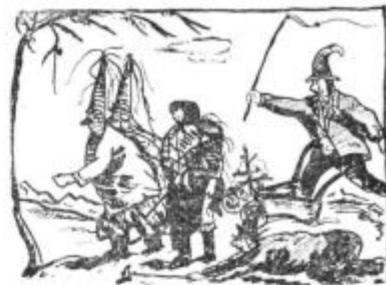
»PUSTNI ORACI«, risba s tušem, Ivan L. osn. šola Cerkevjak