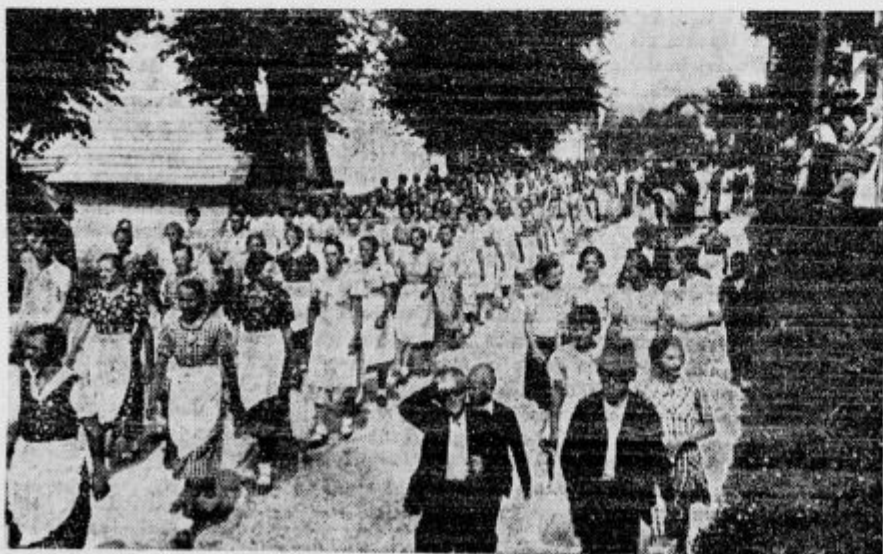
Prosvetni tabor v Črnomlju: Belokranjska dekleta v sprevedu

d Pri zaprtju ali pa pri motnjah v prebavi vzemite jutraj na tešče kozarec naravnih »Franz-Josef« vode.