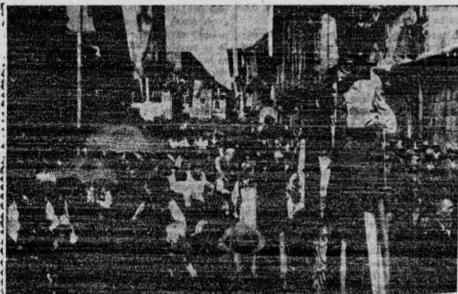
Narodne noše in žlani lastovskih odcekov na veličastnem prosvetnem taboru v Redovljici

Nemški katoličanom je prepovedala romanje v Rim nemška vlada.