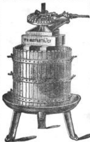
Stiskalnica za vino.