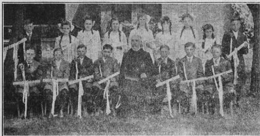
Graduantje šole Marije Pomagaj v Pueblo, Colo.

10. avgusta, drugo nedeljo meseca, se začneja zopet pobožnost 7. nedelj v čast Žal. M. B. za naše krščanske matere. — Mati, začni tudi ti to lepo pobožnost! — Knjižico, kako jo vspešno opraviti, dobiš pri našem uredništvu. Pošlji znamko za 12 centov.