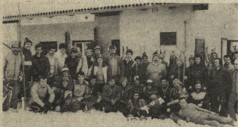
Skupni posnetek nastopajočih na občinskem prvenstvu v tekih za leto 1981 pri Vrunčevem domu na Svetini.