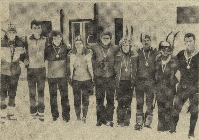
Najboljši s priznanji in kolajnami