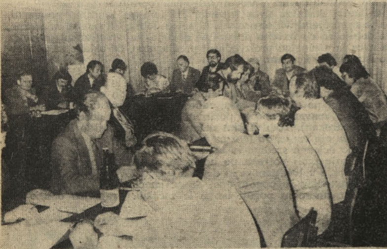
Zbrani delegati — predstavniki DO ob razpravi sporočila III. kongresu samoupravljalcev Jugoslavije v domu Železarjev na Teharju

Se nadaljnje poglobljanje razkoraka med doseženo stopnjo dohodkovnih odnosov v delovnih organizacijah in uveljavljanjem svobodne menjave dela, na osnovah zakona o združenem delu, lahko privede do zaostrenih odnosov v delovnih organizacijah. Saj je od tega odvisen položaj delavcev v TOZD oziroma DSSS. Zato je potrebna v prihodnje povečana aktivnost na tem področju. S prispevkom, ki vsebuje poročilo o naših dosežkih in iskanju nadaljnjih poti, želimo vzpodbuditi predvsem širšo izmenjavo izkušenj, ki v sedanjih pogojih po našem mnenju lahko bistveno prispeva k hitrejšemu in kvalitetnejšemu uveljavljanju svobodne menjave dela.