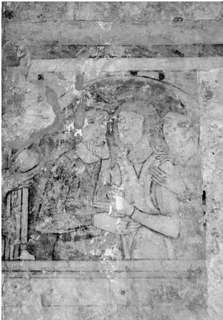
Slika 4: Sv. Nikolaj obdaruje revne neveste, južna slavoločna stena v cerkvi, ok. leta 1310

V kronološko prvo skupino Steletovega korpusa odkritih fresk sodi še votivna podoba Imago pietatis pod nekdanjim zvonikom samostanske cerkve nad prehodom v križni hodnik (slika 5). Trpeči Kristus stoji pod ne navadno robustno skonstruiranim baldahinom in v sarkofagu, za njim je viden črn križ, ob njem na desni strani pa kleči menih z napisnim trakom in napisom: MISERERE MEI DEVS . Zakaj se je slika znašla v ozkem prostoru ob nekdanjem prezbiteriju, Stele ni uspel razvozlati.