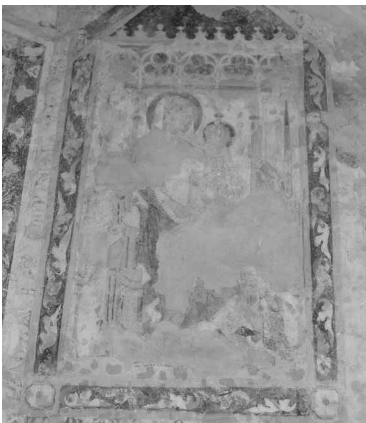
Slika 2: Marija z Jezusom pod baldahinom, 3. pola vzhodnega trakta križnega hodnika, ok. leta 1350

Steletovim branjem 13 prinaša tudi z rimskimi številkami zapisano letnico 1350. Poslikano polje podobe prinaša kompozicijo Marije z majhnim Jezusom na levici, sedeče na prestolu, ob nogah na desni pa kleči donator (slika 2). Tron s profiliranimi nasloni in bogatim, s krogovičjem okrašenim baldahinom je umeščen v prepričljivo poglobljen arhitekturni prostor, to pa izkazuje zelo napreden koncept, pri katerem Stele že prepozna vzorce zgodnjega italijanskega trecenta. 14 Podoben spominski oziroma nagrobni značaj nakazuje tudi fragment podobe dalje proti desni, ki jo je v celoti uničilo obokanje, saj se ob okvirju znova pojavi letnica, tokrat bolj okrnjena, z latinskimi številkami MCCC.