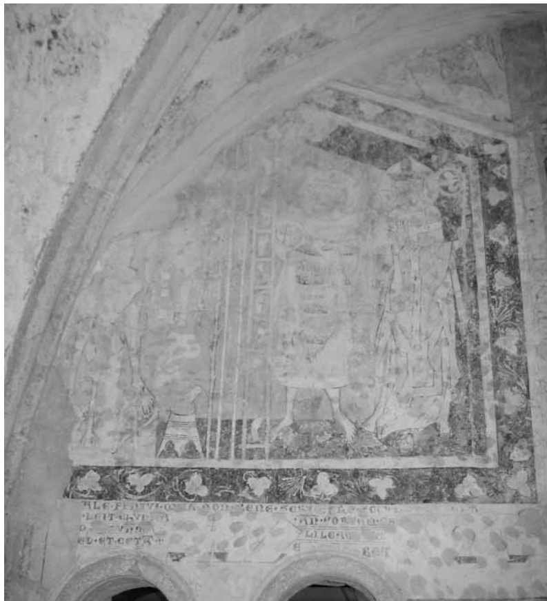
Slika 1: Lestev čednosti, 3. pola vzhodnega trakta križnega hodnika, ok. leta 1330

Slikarije nad desno biforo zaključuje štirivrsten napis v latinski majuskuli. Med besedilo so vkomponirane črno konturirane risbe s figurami, ki vstajajo iz nekakšnih sarkofagov, pač v tipični maniri motiva Vstajenje mrtvih v zadnji sodbi. Napise tudi danes beremo v Steletovi transkripciji, 12 v osrednjem delu pa beremo zelo zanimivo besedilo: (T)ALE /ker prva črka manjka morda tudi (M)ALE/ FINIVI QUIA NON BENE SCRIBERE SCIVI ET (cet) ERA in nato naprej v naslednjih vrsticah. Smisel je zaradi fragmentarne ohranjenosti težko razložljiv, vendar bi lahko zgornje besedilo prevedli tudi takole: »Tako oz. slabo je končal, kdor ne zna pisati.« Vsekakor mikavno, na kaj bi se lahko nanašalo, pa ni jasno. Ne glede na to je pomembnejši napis, ki ob levem in spodnjem robu pripada sosednji sliki na desni, saj s