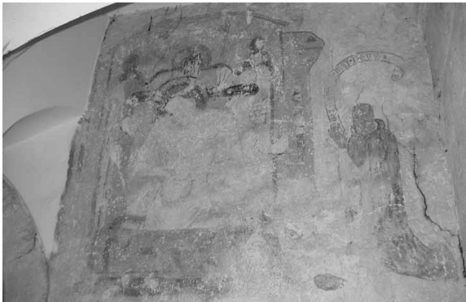
Slika 5: Imago pietatis, podoba nad portalom prehoda iz cerkve v križni hodnik, med 1330–1340

V kronološko drugo skupino je Stele uvrstil dekorativno poslikavo obokov vzhodnega trakta križnega hodnika, ki je po prezidavi in obokanju ostal njegov najpomembnejši del, in jo časovno umestil na začetek 16. stoletja. Nekdaj bržkone bogata, a zelo slabo ohranjena slikarija z iluzionističnim poznogotskim krogovičjem je po nastanku organsko dopolnjevala polja med profiliranimi križnorebrasti oboki, saj so zgodnejše freske pobelili in prekrili z ometom.