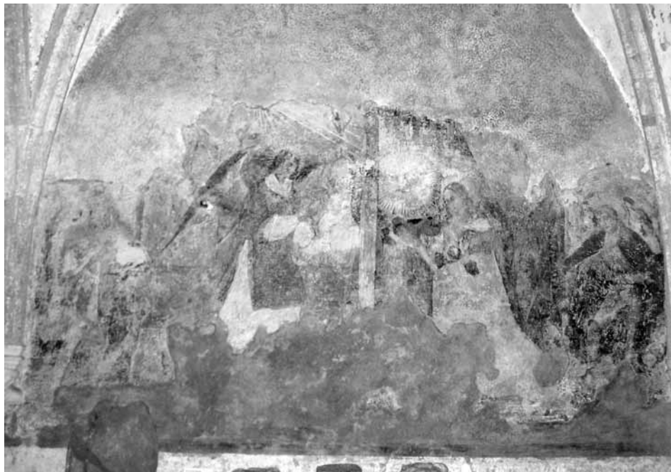
Slika 6: Marijino oznanjenje s sv. Janezom Krstnikom in sv. Mihaelom, ok. leta 1530

Bogat in razčlenjen program stenskih poslikav dominikanskega samostana na Ptuj, sedaj dopolnjen še z novimi odkritji, ne glede na fragmentarno ohranjenost ponuja enega izmed najbolj zanimivih strokovnih izzivov v okviru znanega gradiva stenskih poslikav visokega srednjega veka na Slovenskem in tudi širše.