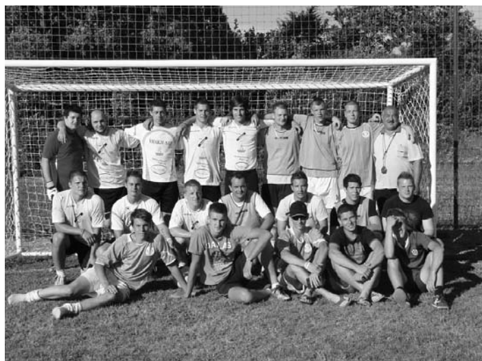
Zmagovalni ekipe v nogometu s sodnikom