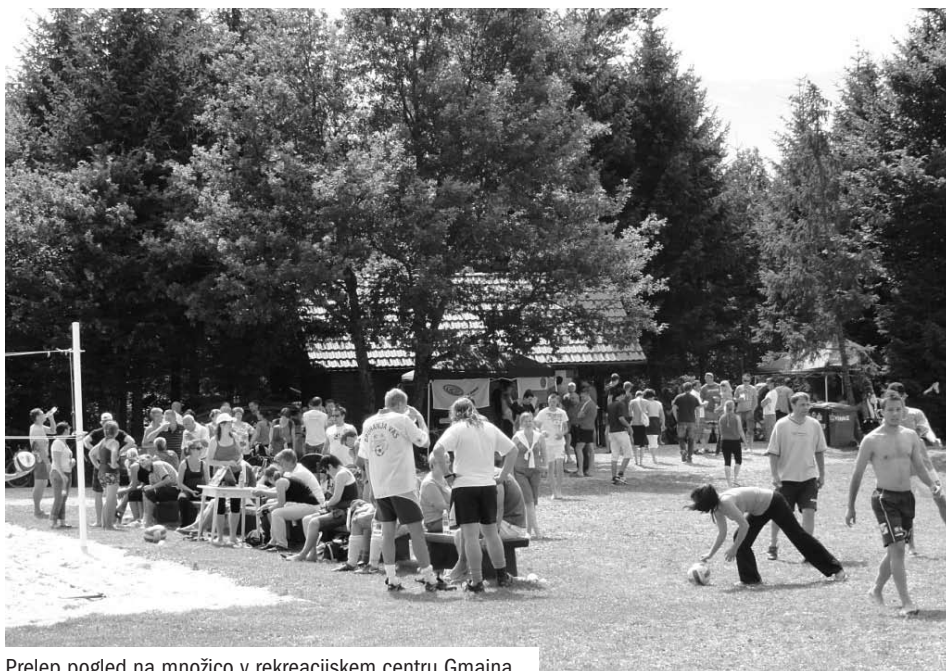
Prelep pogled na množico v rekreacijskem centru Gmajna

Ob dvanajstih je bil čas za prijavo in žrebanje ekip v odbojki na mivki. Teh se je nabralo 11. Bilo bi jih tudi več, vendar smo omejili število ekip, ker so istočasno potekale tekme v nogometu. In se je začelo – z odličnimi tekmami in odlični-