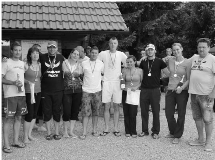
Zmagovalne trojke v odbojki na mivki

»Čudovito, enkratno, težko bi bilo bolje.« To so bile besede tako športnikov kot obiskovalcev prireditve 8. športni dan v Bruhanji vasi.