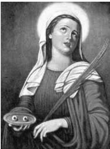
Sveta Lucija, zaščitnica slepih.

A Bog nam kljub grenkobam, ki spremljajo naše življenje, ponuja tudi rešitve, s katerimi se tem grenkobam, kot so denimo srčno žilna obolenja in sladkorna