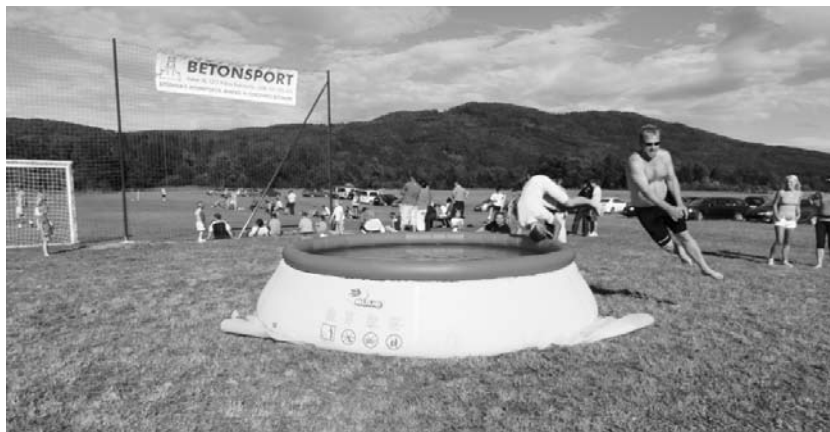
Osvežitev v bazenu

Organizatorji – člani Športnega društva Dobrepolje in vaške skupnosti Bruhanja vas – smo si oddahnili. Utrujeni, vendar zadovoljni. Drug drugega smo spraševali, kako je bilo. Niti sami ne moremo verjeti, da je iz leta v leto boljše in da je vedno več obiskovalcev. Naj traja ... ♦