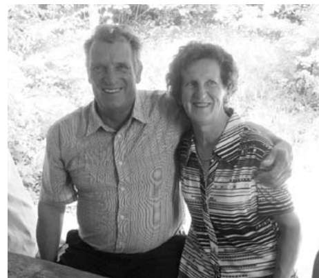
Piknik v Zalipovcu - še vedno zaljubljeni...