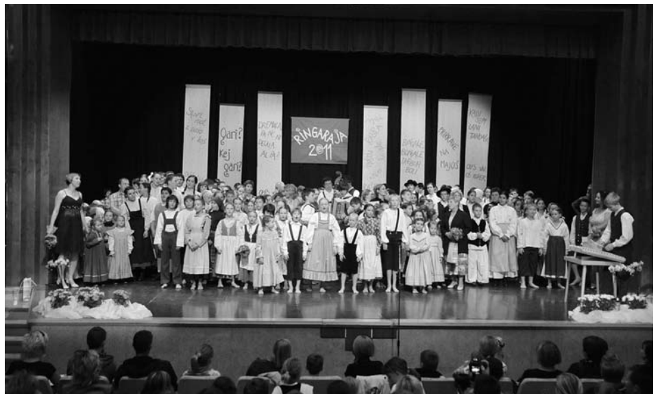
Nastop otroške folklorne skupine v Laškem