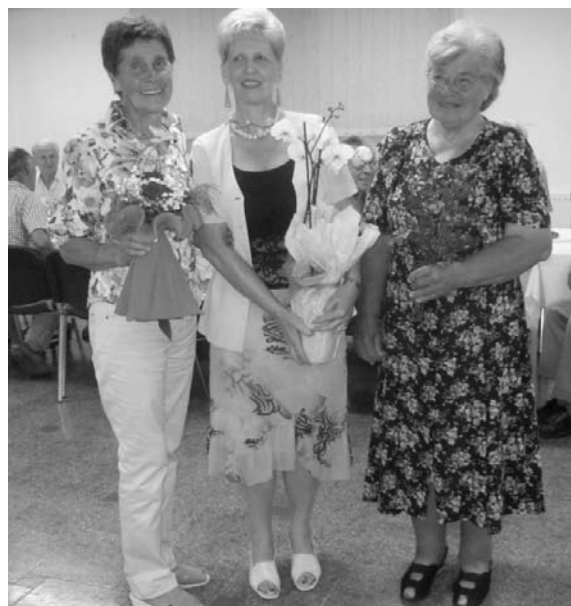
Vse tri slavljenke in njihovih 220 let, in ostali prisotni na praznovanju