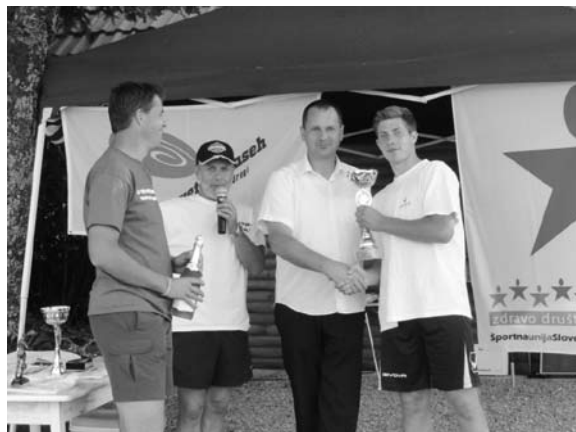
Župan s predstavnikom zmagovalne ekipe