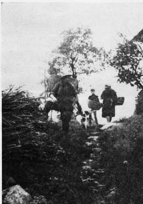
Motiv iz Beneške Slovenie

Vse te publikacije je dobiti tudi v Tržaški knjigarni.