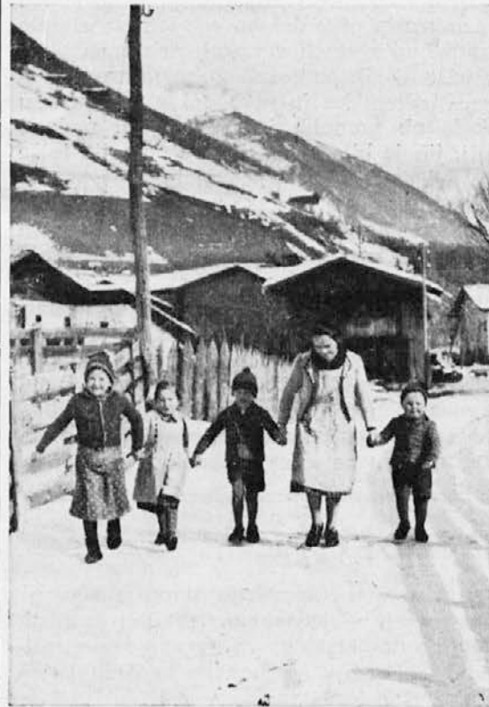
Veselo v novo leto

Za novo leto so bili časniki spet polni »prerokb« raznih »vedeževavcev« o tem, kaj nam bo prineslo leto, v katero vstopamo. Take »prerokbe« so seveda porojene iz čiste fantazije in praznoverja ali iz primitivnega zanašanja na slučaj. Vendar pa bi rad vsak, tudi trezen in pameten, realističen človek vrgel pogled v bodočnost, če bi se dalo, da bi spoznal, kaj nas čaka v novem letu. Toda trezen človek ve, da tega ni mogoče »uganiti«, da tega ne morejo predvideti zakotni vedeževavci, ampak da mu to lahko do neke mere razkrijejo samo predvidevanja, ki temeljijo na dejstvih, na verjetnostnem raču-