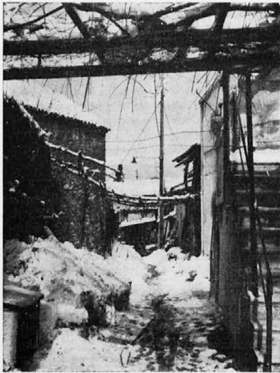
Zimski motiv iz Beneške Slovenije