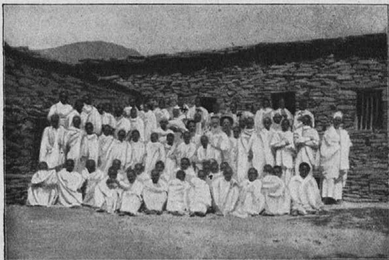
Borno semenišče v Alitieni; misijon oo. lazaristov. Bog nam pošilja mnogo izvrstnih črnih semeniščnikov — pomagajte k stavbi »jubilejnega semenišča«!