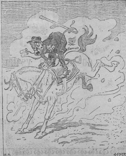
Sacre bleu! Das kann ja eine schöne Geschichte werden!