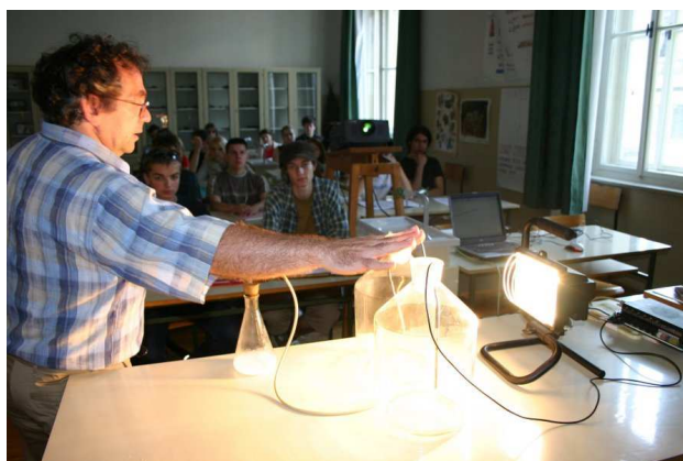
Slika 2: Demonstracija eksperimentalnega dela »Učinek tople grede« na Prvi gimnaziji Maribor.

Figure 2: Demonstration of Greenhouse Effect laboratory work at the Prva gimnazija Maribor.