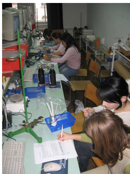
Slika 4: Laboratorij za računalniško podprte meritve na Prvi gimnaziji Maribor leta 2005.

V letu 2005 smo z donacijo pridobili osem računalnikov in sami izdelali ustrezno pohištvo. Danes je tako na šoli specializirana učilnica z osmimi delovnimi mesti. Štirje računalniki so opremljeni z vmesnikom CMC-S3, štirje pa z vmesnikom LabPro. Vsi računalniki so povezani v mrežo in omogočajo dostop do svetovnega spleta (Slika 4).