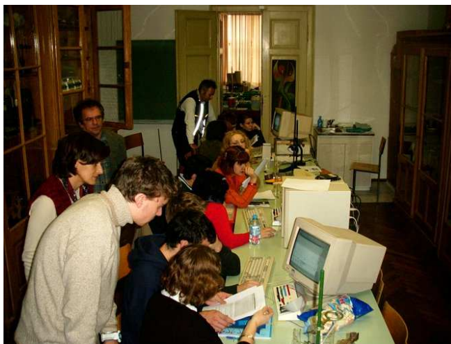
Slika 3: Prvi laboratorij za računalniško podprte meritve na Prvi gimnaziji Maribor leta 2001.

V šolskem letu 2001/ 2002 smo opremili posebno učilnico za potrebe računalniško podprtega laboratorijskega dela pri naravoslovnih predmetih (Slika 3).