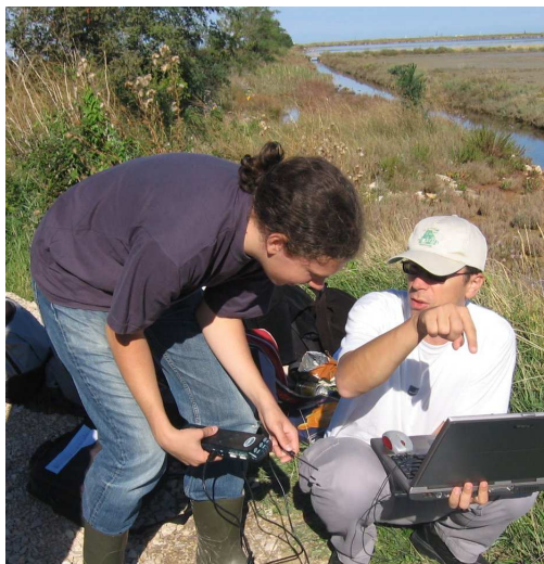
Slika 5: Uporaba vmesnika LabPro za terensko delo.

Figure 5: Use of LabPro probeware for field work.